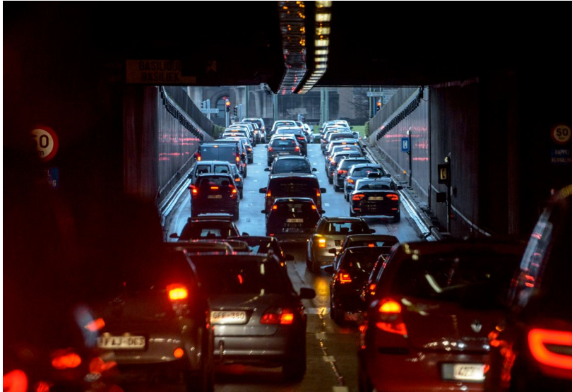
'Brussel heeft ook recht op minder verkeersoverlast en meer levenskwaliteit.'

Randparkings, iemand? Brussel heeft ook recht op minder verkeersoverlast en een betere levenskwaliteit, en dat is allen mogelijk als er minder auto's de stad binnenkomen. De tunnelproblematiek biedt een momentum om na te denken over de echte prioriteiten. Want moeten investeringen in transport niet eerst en vooral op de alternatieven worden gericht, en