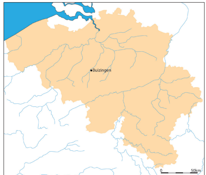
Fig. 1. Situering van Buizingen (tekening Joris Angenon, UGent).

Met een lengte van 11,6 cm behoort deze vondst uit Buizingen eerder tot de kleinere lanspunten. Op het eerste zicht behoort hij tot de categorie short stumpy spearheads , wiens afmetingen minder dan 10 cm bedragen. Omwille van de lan-