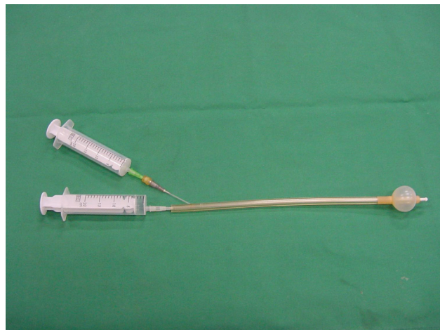
Figuur 2. Franse katheter (osiris pipet) met opgeblazen cuff (de onderste spuit bevat het spermastaal; de bovenste spuit wordt gebruikt om de cuff op te blazen).

Bij een intra-uteriene inseminatie via laparotomie wordt bij een teef die onder algemene anaesthesie is gebracht een kleine incisie van ongeveer 5 cm gemaakt in de linea alba craniaal van de pelvis. De baarmoeder wordt extra-abdominaal gebracht en het ingevroren en ontdoode sperma wordt rechtstreeks in het corpus of de hoorn(en) van de baarmoeder geïnjecteerd met een fijne injectienaald (25G) (Figuur 3). In verschillende landen, zoals de Verenigde Staten, Canada en het Verenigd Koninkrijk en vooral bij het fokken van greyhounds, wordt deze procedure zeer regelmatig