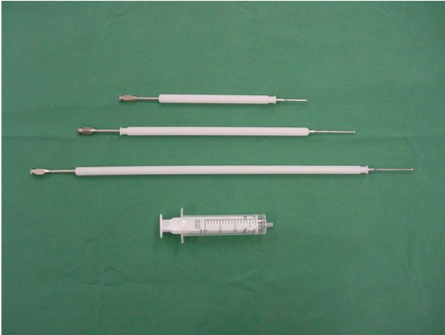
Figuur 4. Transcervicale, Scandinavische katheter (3 verschillende groottes) bestaande uit een nylon speculum en een metalen katheter.