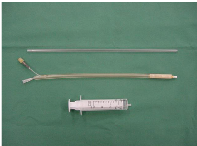
Figuur 1. Intravaginale inseminatiepipetten (bovenaan: plastic inseminatiepipet - midden: Franse katheter (osiris pipet) - onderaan: spuit zonder rubber).

alternatieve methode voor intravaginale inseminatie. Deze pipet bestaat uit een binnenkatheter en een flexibele buitenste mantelpipet met vooraan een opblaasbare cuff (Figuur 2). De pipet wordt intravaginaal ingebracht tot caudaal van de cervix. Vervolgens wordt de cuff opgeblazen en wordt het sperma via de binnenkatheter langzaam craniaal in de vagina gebracht. Tenslotte wordt de pipet met opgeblazen cuff gedurende 10 minuten in de vagina gelaten. De cuff bootst de bulbus van de penis van de reu na en verhindert hierdoor terugvloeiing van sperma. Bovendien stimuleert de cuff contracties die het spermatransport stimuleren. De drachtigheidsresultaten die verkregen worden na inseminatie met de osiris pipet zijn vergelijkbaar met de plastic pipet.