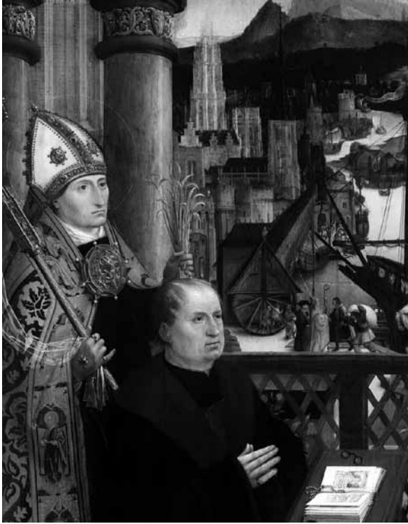
Afbeelding 2: Jan Provoost, Detail van de opdrachtgever met Sint-Nikolaas en een redezicht in de achtergrond, ca. 1515-1521. Musea Brugge-Groeningemuseum, Brugge.