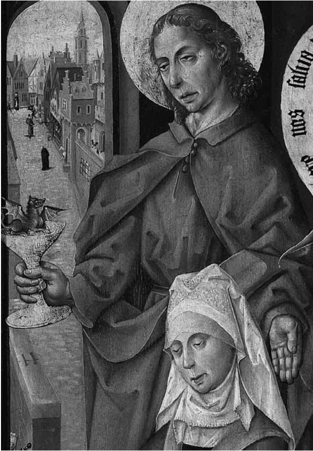
Afbeelding 1: Navolger van Dirk Bouts, Detail van de opdrachtgeefster en het achterliggend straatzicht, Heilige Drievuldigheidstriptiek, 1475-1500. Sint-Servatiuskerk, Berg.

themanummer in de Journal of Interdisciplinary History . 7 Naarmate picturale bronnen hun secundaire, doorgaans illustratieve functie gingen overstijgen en een steeds prominentere rol opeisten in het historisch onderzoek, groeide de nood aan een eigen methodologie en historische kritiek. Rond de eeuwwisseling verscheen een aantal handboeken die houvast bieden aan historici die aan de slag willen met iconografisch materiaal zoals stadsrepresentaties. Vele van de conceptuele tools die in deze werken worden aangereikt zijn schatplichtig aan de taalwetenschappen en hebben betrekking op discoursanalyse (zender-boodschap-ontvanger), de kwantitatieve verwerking van beeldmateriaal en semiotiek. 8