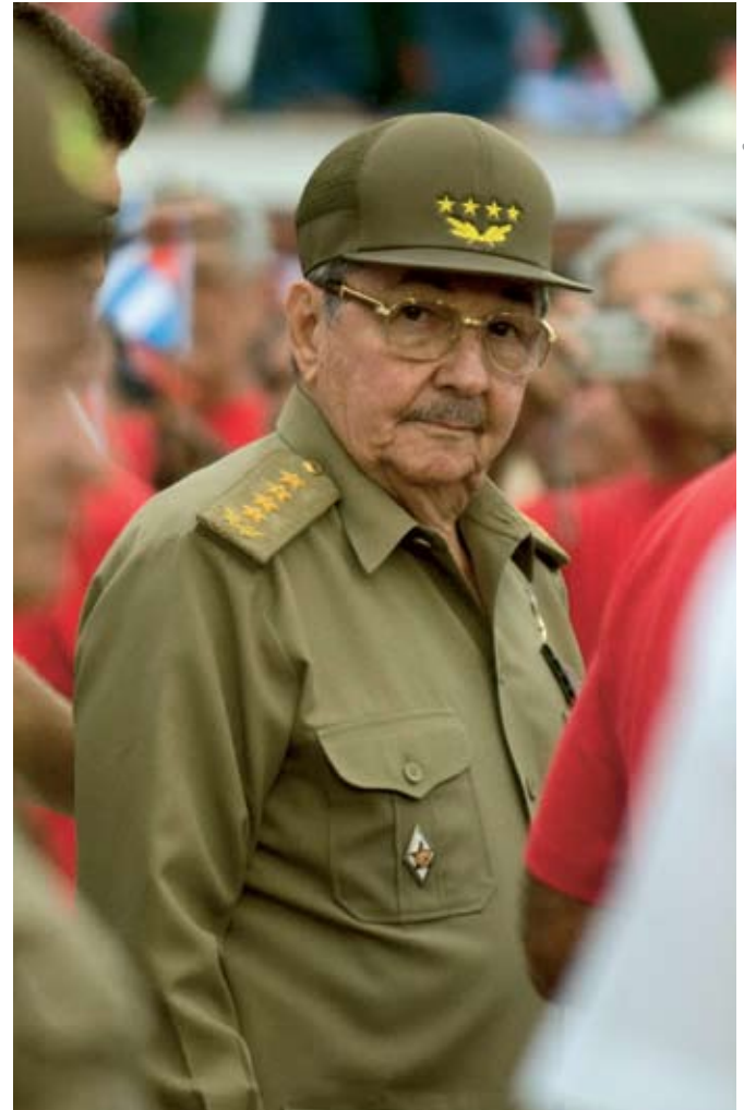
Raúl Castro, de jongere broer van Fidel, is de huidige sterke man van Cuba.

Nu kunnen de Cubanen computers en mobiele telefoons kopen.