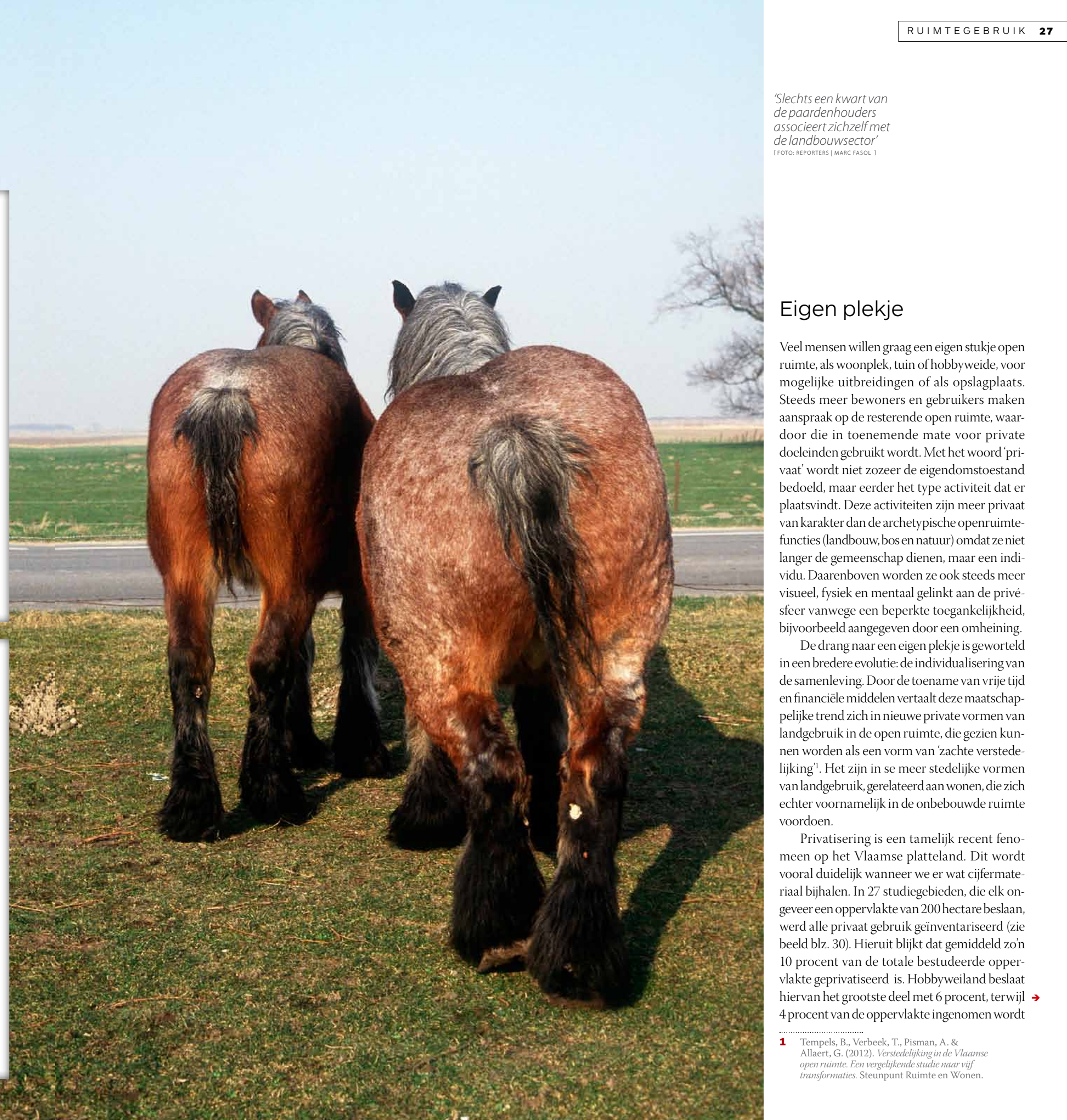
‘Slechts een kwart van de paardenhouders associeert zichzelf met de landbouwsector’