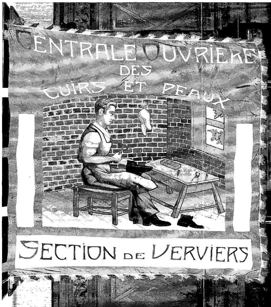
Vlag van de Centrale der Leder- en Vellenbewerders van Verviers, ongedateerd