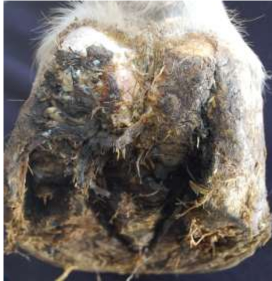
FIG. 1: Foto van het pathognomonisch uitzicht van een vergevorderd geval van hoefkanker. Het caudaal aspect van de straal vertoont uitgebreide, draderige epitheliale proliferaties die zich verder uitstrekken tot de hoefballen.

hoogte van het achterste deel van de straal en vaak ook de hielballen (Fig. 1). Aangezien alle paarden die in de kliniek werden aangeboden matige tot ernstige letsels vertoonden en er bijgevolg geen twijfel kon bestaan over de diagnose, werd geen bijkomend histologisch onderzoek verricht.