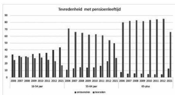
Figuur 3: Tevredenheid met de eigen (verwachte) pensioenleeftijd, voor drie leeftijdsgroepen