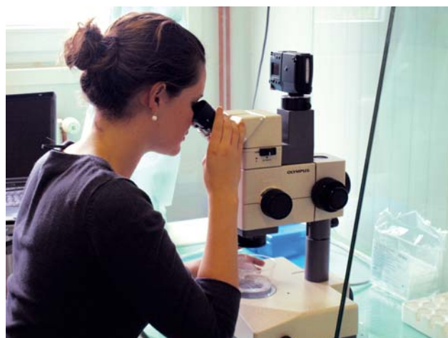
Figuur 3. Het microscopisch onderzoek van het embryo.