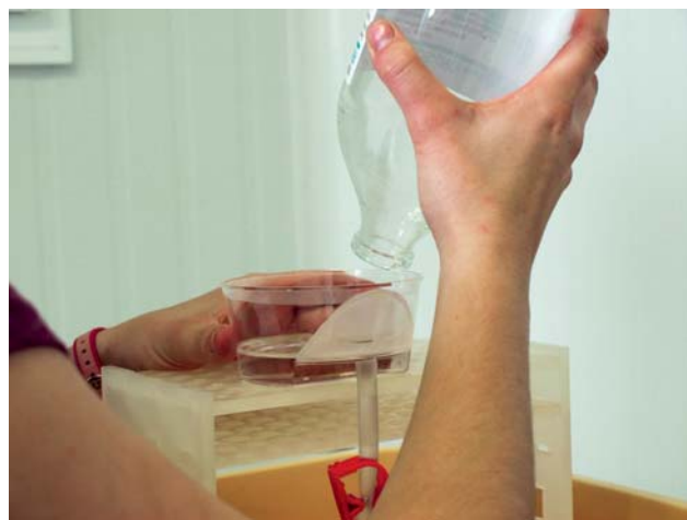
Figuur 2. Het handmatig filteren van de spoelvloeistof.

Wanneer het embryo niet-chirurgisch wordt overgeplant, kan men gebruik maken van een cassoutransferpipet of een inseminatiepipet die transcervicaal, onder vaginale begeleiding, in de uterus wordt gebracht. Het embryo zelf bevindt zich in een 0,25 - 0,5 ml-rietje. De cassouppipet wordt omgeven door een steriele, harde plastic beschermhuls met eromheen een flexibel plastic omhulsel ('chemise'). Wanneer de pipet zich in de cervix bevindt, wordt het omhulsel of de 'chemise'