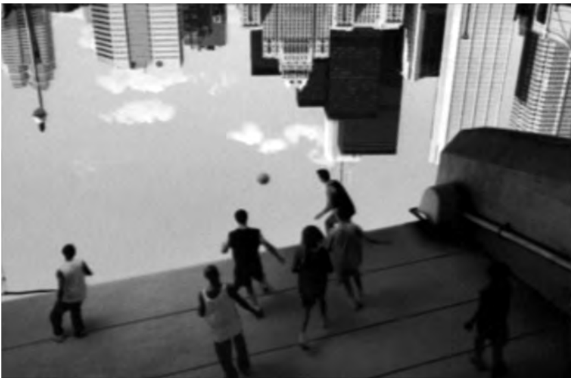
Figura 13: Upside down , Peugeot, 2001

(Kerckhove, 1997: 38). Mexem connosco e, sobretudo, conduzem-nos a experienciar o impossível. Eis a principal razão para o tamanho do quadro ter que ser maior do que o tamanho do mundo. Para pintar, além das paisagens e das histórias previstas por Alberti, o sonho e o impossível.