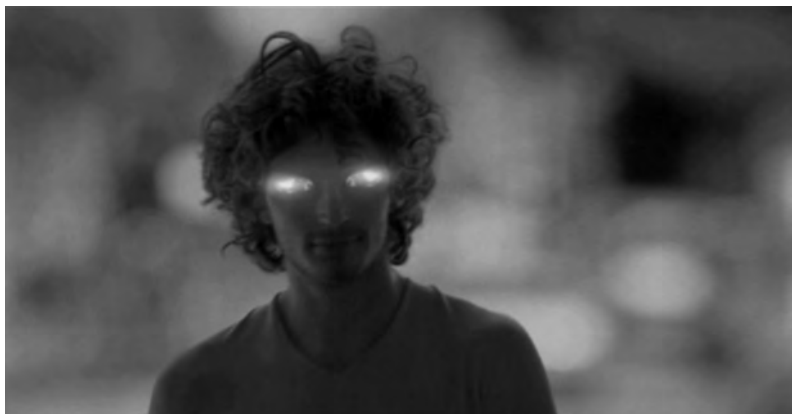
Figura 16: Evolution , Renault, 2006

Este procedimento resulta bastante vulgar no imaginário contemporâneo, que, aliás, caracteriza. Não surpreende, portanto, o sucesso granjeado na área da publicidade. Não só as coisas se transformam em figuras humanas (por exemplo, o Bibendum , o Homem da Michelin, criado em 1898) como, proeza que Arcimboldo não ousou conceber, seres humanos se transformam em coisas (por exemplo, nos anúncios Evolution 62 , da Renault, e Human car 63 , da Ford, um jovem e um grupo de bailarinos transformam-se em carros).