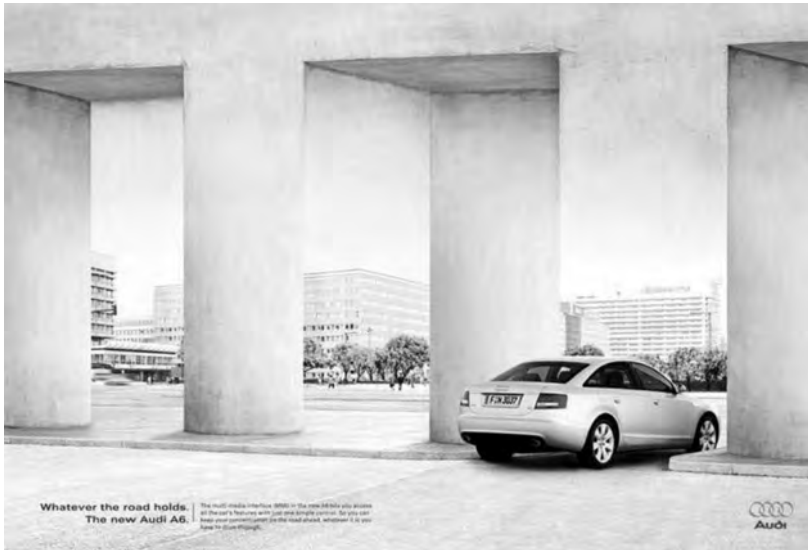
Figura 12: Illusions , Audi A6, 2004 ( Outdoor )