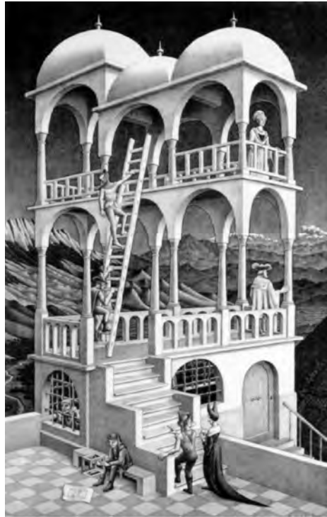
Figura 10: M. C. Escher, Belveder , 1958

Retornemos ao anúncio Perspective da Lexus. O carro pára no ponto em que se gera a ilusão. Um ser em pedaços mostra-se inteiro. Suspenso no ar, parece, agora, integrar um plano bidimensional. Parado, elevado, estampado, a posar para a eternidade, faz lembrar um ícone da arte (copta, bizantina, pop art ou outra). Estes traços configuram uma representação que se situa nos antípodas da perspectiva.