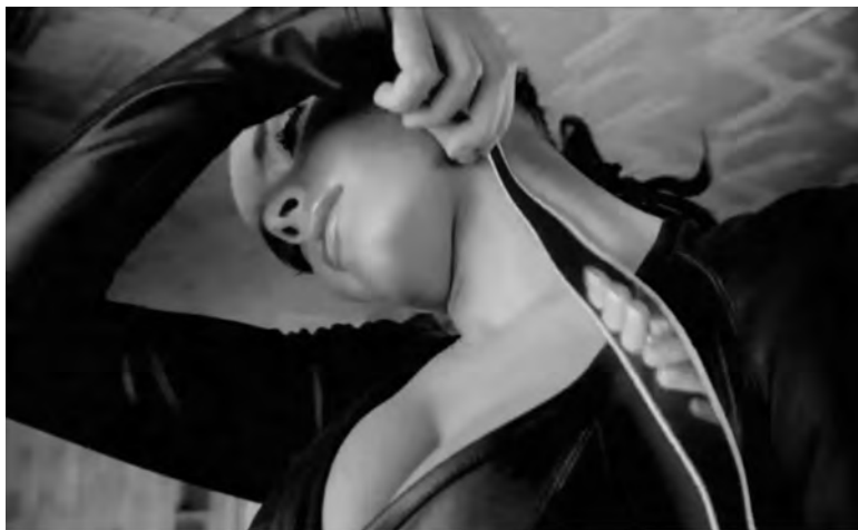
Figura 18: Look what's inside , Unilever, 2007

Estes dois anúncios propõem-nos duas leituras distintas da fragmentação, que, sublinhe-se, não implica necessariamente alienação. Em Look what's inside , deparamo-nos com uma coleção de mulheres; em Recette d'une femme mode , com uma mulher plural. Esta última, pode não saber exactamente quem é, nem conseguir regressar ao núcleo da sua individualidade, o “não sei quê” que talha a identidade e o “quase nada” que faz toda a diferença (Jankélévitch, 1980). Tropeça, mesmo assim, no nome e na carne. Este texto já vai longo e quanto mais se expande mais se assemelha a um mosaico do Gaudi no Parque Güell. Urge encontrar um par de chaves para o fechar.