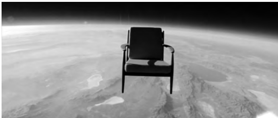
Figura 1: Space chair , Toshiba, 2009

tenta esmagar automóveis Peugeot 6 ou aqueloutro que pesca homens utilizando um Renault Clio como isco 7 , não deixam de lembrar o bom Gargântua a roubar os sinos da catedral de Notre-Dame de Paris. Mas o gigante que nos torna míopes é aquele em que estamos embarcados: o nosso planeta. Seria despropositado traçar uma lista dos anúncios que mostram a Terra fotografada ou filmada do espaço. Vamos cingir-nos a uma publicidade recente da Toshiba ( Space chair 8 ): uma cadeira, suspensa num balão, munida com oito câmaras, filma, à medida que sobe, o planeta Terra. O slogan da versão portuguesa é particularmente sugestivo: “inovar é ver como ninguém viu”. “Ver como ninguém viu”, porventura mais do que ver “o nunca visto”, eis a tentação ou, melhor, a proposta que percorre a publicidade actual.