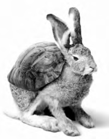
Figura 5: Hale/Tortoise , Volkswagen, 2002

No anúncio Fountain 36 , da Audi, coabitam duas configurações espaço-temporais: uma, acelerada e a outra, retardada. Numa estrada de montanha, um automóvel pisa um lençol de água provocando um jacto que se precipita em câmara lenta; entretanto, o carro desce a encosta a alta velocidade e estaciona; após um compasso de espera, a água cai, sempre em câmara lenta e com belo efeito, sobre o automóvel. Embora opostas, as duas configurações espaço-temporais não se limitam a coexistir, também interagem.