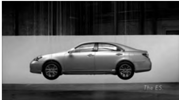
Figura 11: Perspective , Lexus, 2008