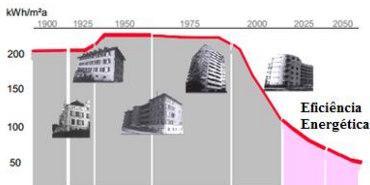
Figura 1: Evolução do consumo de energia no Parque Habitacional Europeu (Silva, Almeida, Bragança, Mesquita, 2009)

Europa. Em Portugal, a situação é ainda mais gravosa dado que 81% do parque habitacional edificado foi construído antes de 1990, ou seja, antes da publicação do primeiro Regulamento das Características do Comportamento Térmico dos Edifícios, pelo que a grande maioria dos edifícios apresenta elevados consumos energéticos e baixos níveis de conforto (Silva, Almeida, Bragança, Mesquita, 2009). Em baixo, na Figura 1, é representada a evolução do consumo de energia no Parque Habitacional Europeu.