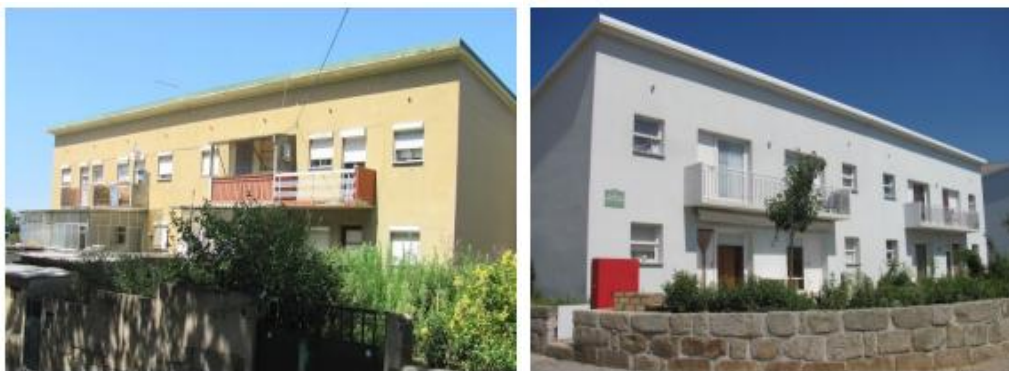
Figura 4: Edifício antes da reabilitação (à esquerda) e depois da reabilitação (à direita) (Almeida, Ferreira, Brito, Baptista, et al., 2014).

Serve de exemplo, o Caso de Estudo Bairro Rainha Dona Leonor, edifício multifamiliar, com dois fogos, situado no Porto e construído em 1953. A sua reabilitação teve início em 2009 e conclusão em 2014, onde o processo de reabilitação passou essencialmente pela colocação de isolamento nas paredes exteriores e cobertura e ainda o uso de vidro duplo e madeira nas janelas do edifício. Para além destas práticas, foi incorporado, por exemplo, um sistema solar térmico para água quente sanitária e um sistema de aquecimento e arrefecimento eficiente. Nas figuras que se seguem, é apresentado o antes e depois da reabilitação (Almeida, Ferreira, Brito, Baptista, et al., 2014).