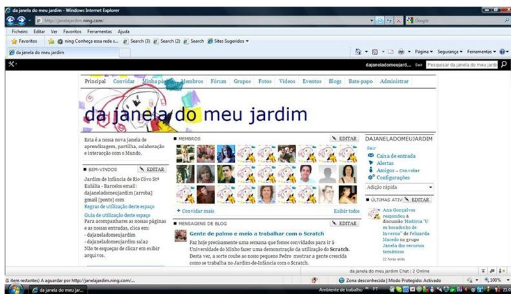
Figura 1 Aspeto parcial da rede social da janela do meu jardim

um espaço unicamente limitado à interação de crianças-educador, mas antes que promova habilidades e literacias no uso dos artefactos tecnológicos, com a participação e colaboração de toda a comunidade educativa. É neste contexto que, em 2007, surge a criação da plataforma, no endereço janelajardim.ning.com . O seu aparecimento justificava-se, por um lado, pela necessidade de responder aos desafios da Sociedade de Informação e, por outro, para responder à integração das TIC em contexto de Jardim de infância. Pretende ser não uma solução, mas uma resposta, um caminho possível para a integração das tecnologias no Jardim de infância de Rio Covo Santa Eulália - Barcelos, bem como potenciar uma maior aproximação/interação entre todos os membros da comunidade educativa.