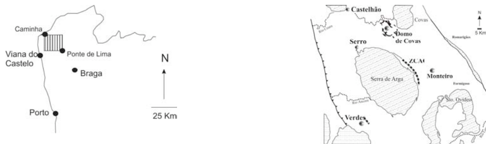
Fig. 1 - Localização das diversas ocorrências de mineralização tungstífera no domínio geográfico envolvente do maciço granítico da Serra de Arga.

rochas ricas em granite. Associações semelhantes a estas observam-se em alguns locais dos terrenos Silúricos que envolvem a Serra de Arga.