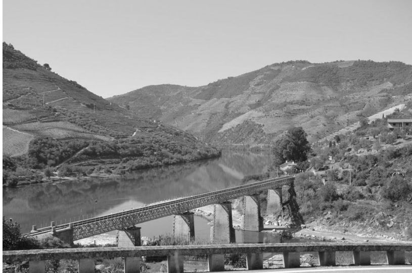
Fotografia 1. Confluência do Rio Tua com o Douro, junto a Foz Tua.

Do ponto de vista climático a área de estudo caracteriza-se por uma distribuição heterogénea da precipitação, observando-se uma concentração mais significativa no setor N e NE, onde atinge valores totais anuais superiores a 1200 mm, contrastando com os valores próximos dos 400 mm, no setor intermédio do vale do Tua. Quanto à temperatura, mantém-se o comportamento heterogéneo da sua distribuição, atingindo-se valores médios anuais inferiores nos setores N e E e O, da ordem dos 7° C, correspondentes a áreas topograficamente mais elevadas, sendo esses valores mais elevados no vale do Tua nomeadamente na aproximação ao vale do Rio Douro, onde se atingem valores médios anuais superiores a 17° C.