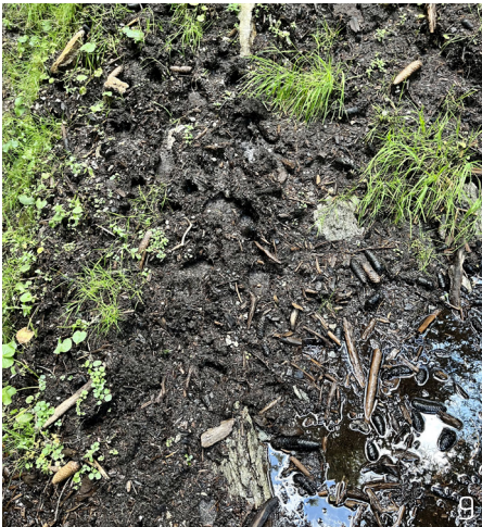
Abbildung 9: Trittschäden im Quellbereich einer alpinen Quelle bedingt durch Weidetiere.