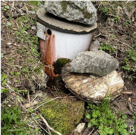
Abbildung 8: Gefasste Quelle mit einer kleinen Brunnenstube und Überlauf.