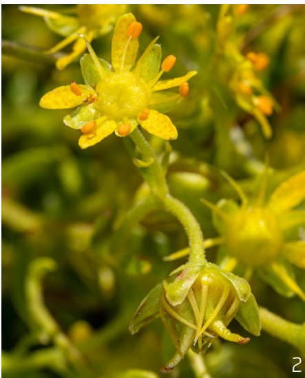
Abbildung 2: Der Bach-Steinbrech auch Quell-Steinbrech genannt, besiedelt neben Bachrändern und feuchten Hängen vor allem Quellfluren. Die Art ist rasenbildend und zeichnet sich durch ihre fleischigen Blätter und ihren zitronengelben Blüten aus.

Die Temperatur gilt für die meisten biologischen Prozesse als Schlüsselfaktor. Es ist daher anzunehmen, dass sich die Lebensgemeinschaften in den Quellen aufgrund des Klimawandels und der damit einhergehenden Temperaturerhöhungen in Zukunft verändern werden. In einer Studie im Lötschental wurde der Zusammenhang