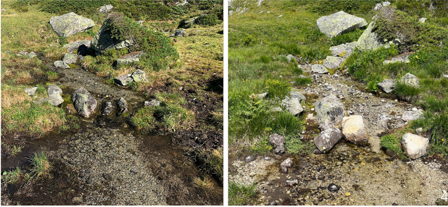
Abbildung 4: Verringerung der Abflussmengen aufgrund anhaltender Hitze. Betrug die Schüttung einer Quelle auf der Bettermeralp im Jahr 2020 noch 3.0 l/s (Bild links), verzeichnete sie im Hitzesommer 2022 lediglich eine Abflussmenge von 0.3 l/s (Bild rechts). Die Unterschiede waren hinsichtlich der benetzten Breite, der Quellbachtiefe und einer abweichenden Vegetation auszumachen.