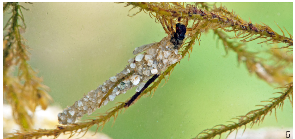
Abbildung 6: Drusus muelleri - eine endemische Köcherfliege der Westalpen , welche in ihrem Verbreitungsgebiet auf die subalpine und alpine Höhenstufe beschränkt ist. Im Einzugsgebiet des Lötschentals konnte diese kälteangepasste Art grösstenteils in Quellen oberhalb 1900 m ü. M. nachgewiesen werden. Die Art wird stark mit den Auswirkungen des Klimawandels konfrontiert werden und kann lokal aussterben.