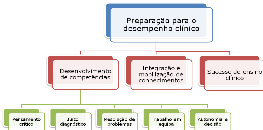
Figura 1. Tema "preparação para o desempenho clínico", suas categorias e subcategorias

O primeiro tema, assumido com relevo como tema central, compreende as categorias "desenvolvimento de competências", "integração e mobilização de conhecimentos" e "sucesso do ensino clínico", representadas na figura 1.