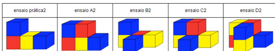
Figura 2 - Ensaio da tarefa (a criança Y descreve enquanto a criança X executa)

As crianças mostraram-se, desde o início, envolvidas e empenhadas na realização da tarefa proposta e desinibidas perante a presença da máquina de filmar e gravador. A utilização dos cubos coloridos foi uma mais-valia, pois via-se nas crianças a vontade em participar, mexer e explorar os cubos. Note-se que os cubos utilizados na resolução das tarefas eram diferentes dos materiais existentes nas diferentes salas de aula. Apesar de nas salas do pré-escolar existirem alguns cubos de madeira, estes fazem parte de kits com outros sólidos (cilindros, prismas, pirâmides, etc.), não são coloridos, e geralmente são utilizados pelas crianças nas suas brincadeiras de faz de conta. Nas salas do primeiro ano não é tão usual encontrar este tipo de materiais, apesar de neste agrupamento existirem dois baús da matemática que circulam pelas diferentes salas dos diferentes estabelecimentos de ensino do 1.º CEB e pré-escolar. Estes baús contêm alguns materiais (torre de Hanói, cartas do Tio Papel, cartas do jogo do 24, jogos do campeonato nacional de jogos matemáticos, etc.), no entanto, não possuem cubos coloridos semelhantes aos utilizados neste estudo.