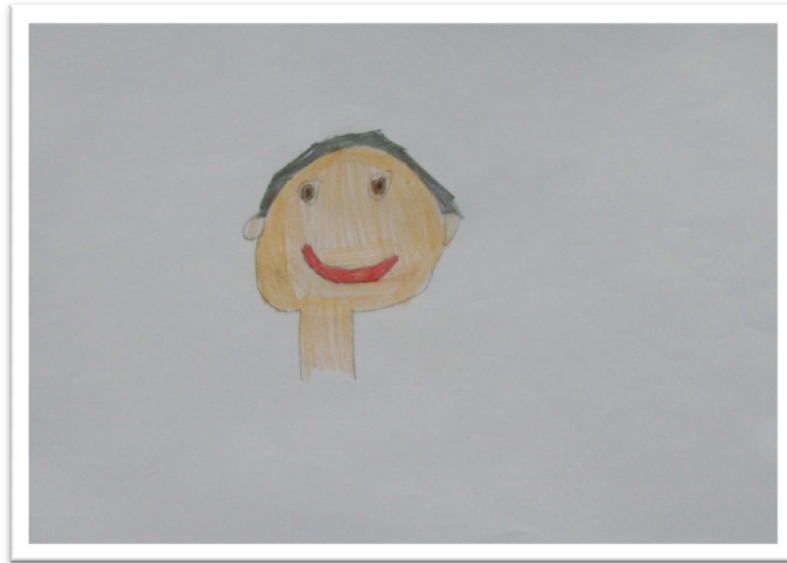
Figura 1 - Tiago, 7 anos. Quando compôs o desenho, estava em fase de remissão de Leucemia Linfoblástica Aguda- grau 2, e a tratar com quimioterapia de 10 em 10 semanas. Tema: o meu retrato.