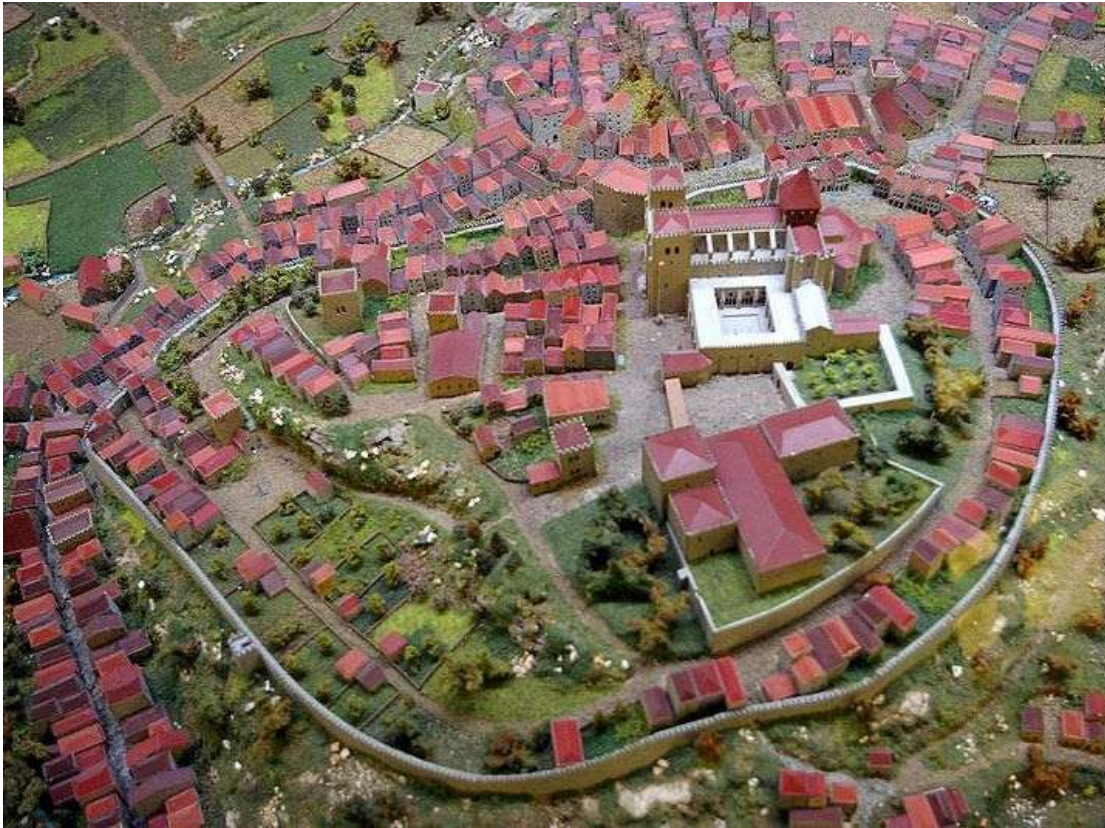
Figura 2- Reconstituição do Morro da Sé do Porto (maqueta do Arquivo Municipal do Porto)

sofrerá a concorrência forte dos novos mosteiros mendicantes, então criados noutra zona da cidade 28 .