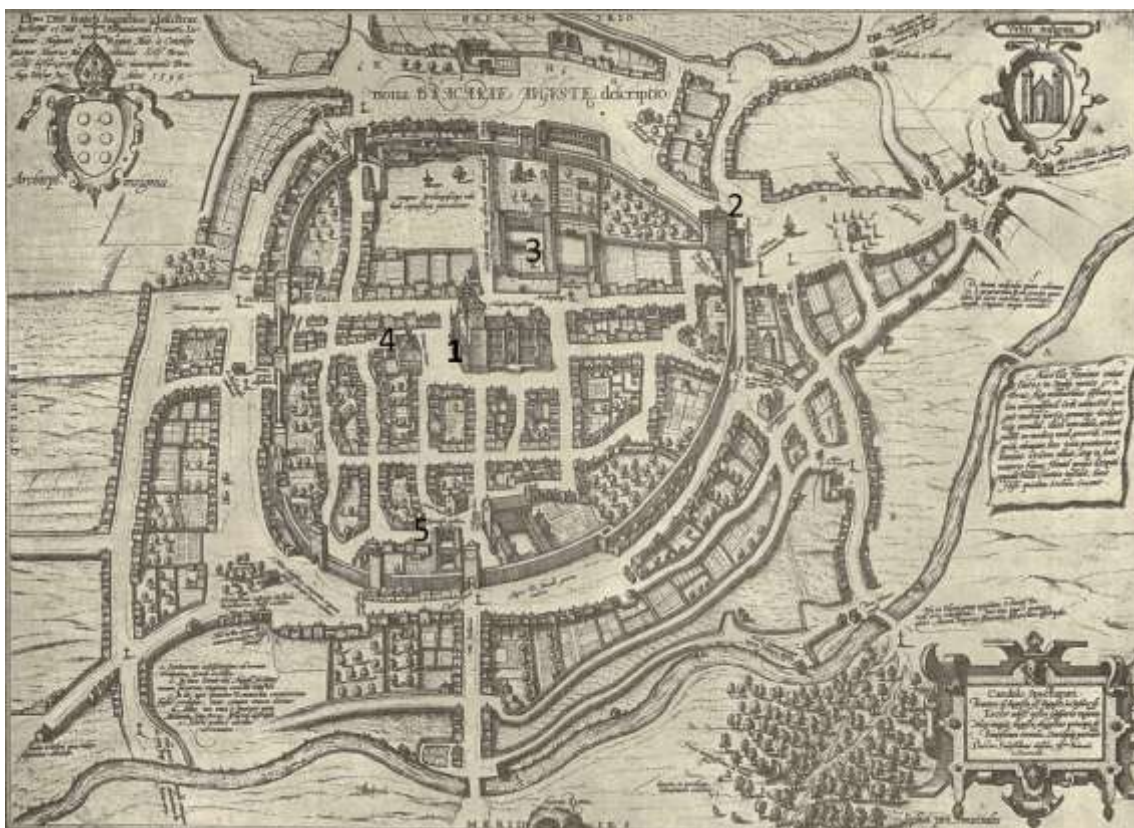
Figura 3 - Mapa de Braunio de Braga (1594). 1 - Sé; 2 - Castelo; 3 - Paço Arquiepiscopal; 4 - Casa da Câmara; 5 – Estudos Públicos.

A primeira referência escrita conhecida ao Castelo de Braga data de 1315, muito embora o ano exato do início da sua construção seja desconhecido, sendo, também, impossível de determinar se, naquela data, as obras já se encontrariam completamente ultimadas. Igualmente permanece discutível quem o terá mandado construir, o rei, neste caso, D. Dinis, ou os arcebispos, embora a generalidade dos autores se incline para estes últimos 37 , constituindo, nesse caso, uma afirmação do poder senhorial do arcebispo.