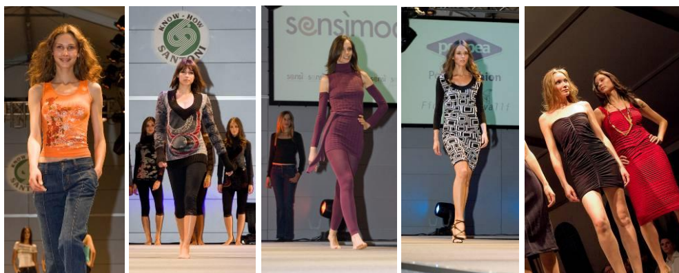
Figura 3: Vestuário exterior em seamless (SANTONI DAYS, 2008).

A Santoni realiza anualmente o “Santoni Days”, com objetivo de lançar novos teares e mostrar por meio de coleções as suas aplicabilidades. Paralelamente, realiza um desfile com peças selecionadas (figura 3), dentre as produzidas pelos seus clientes, para estimular novos desenvolvimentos e aquisições, além de modelos concebidos pelo Instituto Machina (Escola Superior de Moda e Design do Grupo Lonati).