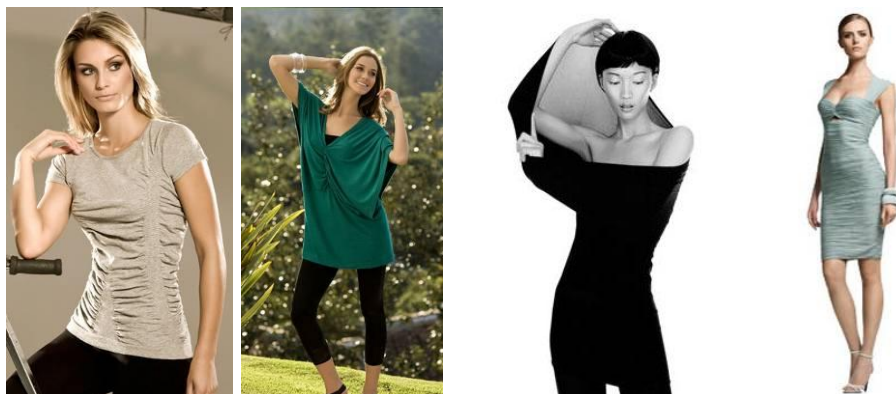
a) Scala prêt-à-porter

StarckNaked (figura 2 b). Os primeiros itens prêt-à-porter são lançados em 2005 (WOLFORD 2009).