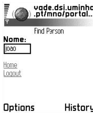
Figura 2 – Parametrização da funcionalidade

A integração desta funcionalidade na aplicação baseia-se em duas abordagens distintas: global, em que os resultados obtidos referem-se a todo o ambiente (não dependem da localização); restrita, em que os resultados obtidos dependem directamente da localização do utilizador.