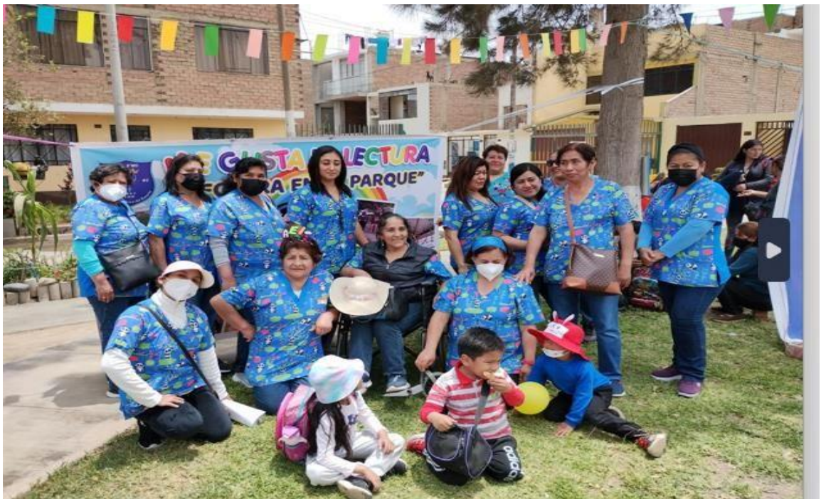
TODOS PARTICIPARON CON ALEGRÍA Y ENTUSIASMO. ¡GRACIAS IEI 003!