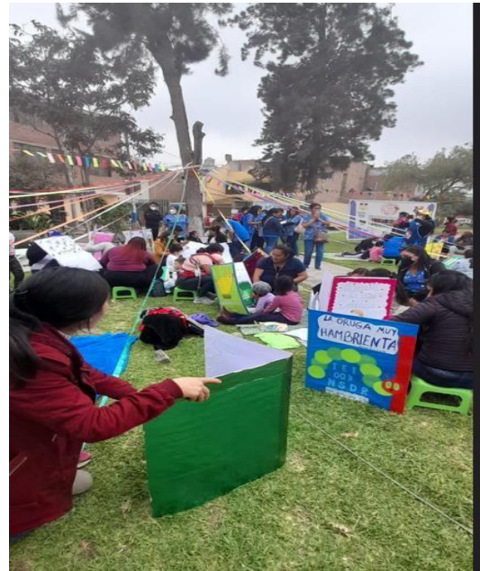
Los cuenta cuentos gigantes