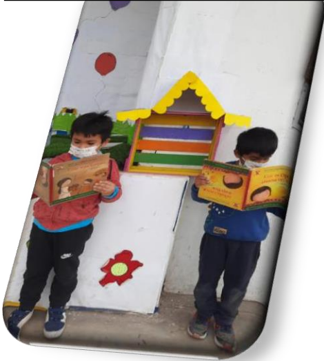
er antes de dormir