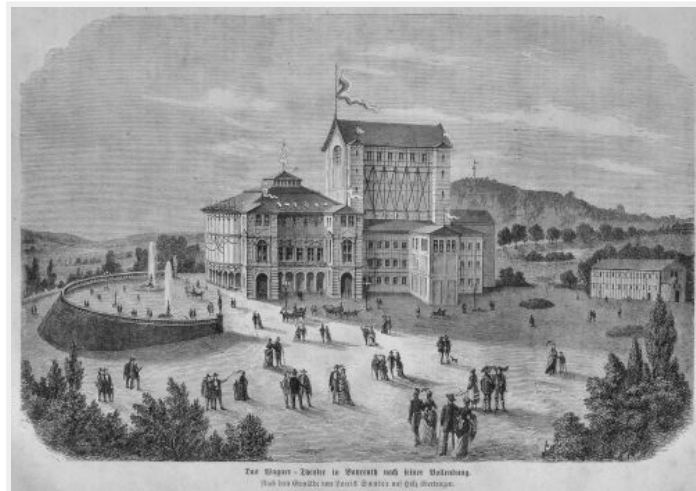
BAYREUTHER FESTSPIELHAUS IN 1873

Voor de bruiloft van Gabriel en Olga schreef Nietzsche een stuk voor piano quatre mains, getiteld 'Monodie (alleenspraak) à deux'. [1] Dit hoogromantische stukje muziek is een van de weinige bewaarde bronnen die getuigen van directe contacten tussen Monod en Nietzsche. Desondanks lijkt het erop dat ze gedurende enkele jaren vriendschappelijke betrekkingen onderhielden. [2] In elk geval hebben ze elkaar in 1876 opnieuw ontmoet toen beiden Wagners eerste Festspiele in Bayreuth bezochten. Hun ervaringen daar waren heel verschillend. Nietzsche walgde van het hoogburgerlijke en nationalistische publiek dat dweepte met kunst die het volgens hem niet begreep. Bayreuth genas hem voorgoed van zijn idolatie voor Wagner. Monod was echter verrukt en herinnerde zich de eerste Festspiele gedurende zijn hele leven als een moment van ware esthetische vervoering. Ook hij kritiseerde het snobisme dat in latere jaren fataal was voor de geest van Bayreuth. Maar op die eerste Festspiele van 1876 was daar, meende hij, nog geen sprake van.