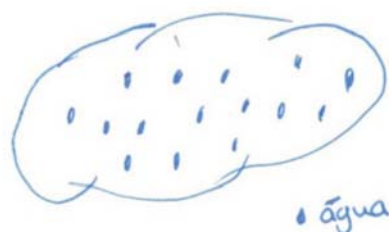
Figura 1 - Representação macroscópica de uma nuvem formada por água (P41)

No entanto, alguns estudantes recorrem a representações macroscópicas (figura 1) enquanto que outros descem ao nível do sub-microscópico (figura 2).