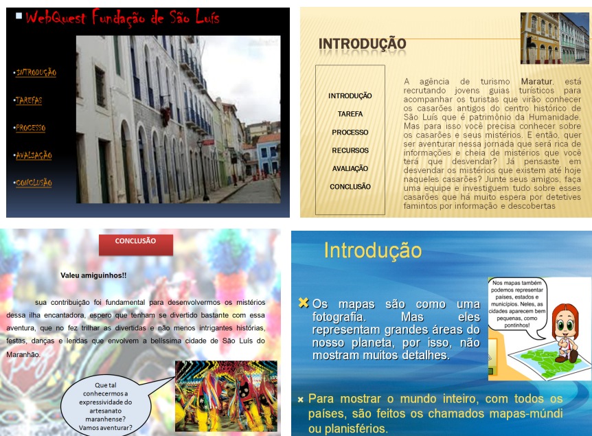
Figura 2 - Algumas das WebQuests realizadas pelos alunos

valorizados na construção das estratégias estavam a preservação do meio ambiente, a construção de mapas, o aquecimento global, o turismo e a língua inglesa. Alguns dos trabalhos realizados pelos alunos estão disponíveis na figura 2.