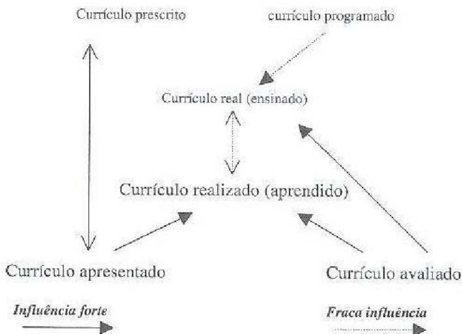
Fig. 1: Interrelação nas etapas de desenvolvimento curricular (Glatthorn, 1997). Adaptado.

Apesar da existência de uma ordem decisional na interligação das fases de desenvolvimento do currículo que subjaz a um sistema curricular centralizado, constatamos que apenas uma abordagem compreensiva poderá adaptar-se a um sistema curricular que se deseja descentralizado mas que, ao mesmo tempo, é uma intercruzilhada de práticas que exige consensos a diversos níveis de acção.