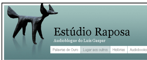
Figura 2. Podcast “Estúdio Raposa”

Outros podcasts dão a conhecer obras, contos e poemas de autores nacionais e estrangeiros e que podem ser usados pelo professor na sala de aula. São disso exemplo os podcast “Estúdio Raposa” 12 (Fig. 2) ou o exemplo dos podcasts de apoio à disciplina de Língua Portuguesa das professora Teresa Pombo 13 (Fig. 3) e Adelina Moura 14 (Fig. 4).