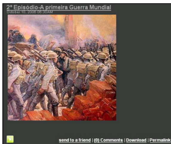
Figura 7. Podcast criado por um grupo no âmbito do estudo da I Guerra Mundial