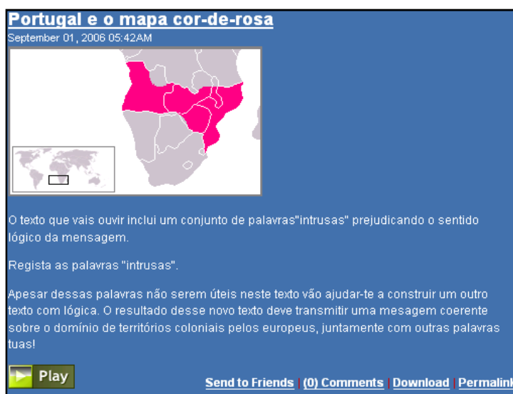
Figura 5. Actividade proposta no podcast da disciplina

O podcast “ historianove ” 15 versa sobre a Hegemonia e Declínio da Influência Europeia cuja proposta de trabalho convidava os alunos a ouvirem o episódio gravado, sendo que este possuía palavras intrusas que deturpavam o sentido lógico da mensagem. Assim, num primeiro momento, a tarefa proposta aos alunos era a de que depois de ouvirem o episódio, identificassem as palavras intrusas e, com elas, construíssem um novo texto que transmitiria uma mensagem coerente sobre o tema em estudo, que por sua vez seria publicado pelos próprios alunos no podcast, enquanto registo escrito (Fig. 5).