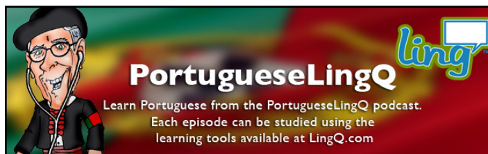
Figura 1. Podcast PortugueseLingQ

Outros podcasts dão a conhecer obras, contos e poemas de autores nacionais e estrangeiros e que podem ser usados pelo professor na sala de aula. São disso exemplo os podcast “Estúdio Raposa” 12 (Fig. 2) ou o exemplo dos podcasts de apoio à disciplina de Língua Portuguesa das professora Teresa Pombo 13 (Fig. 3) e Adelina Moura 14 (Fig. 4).