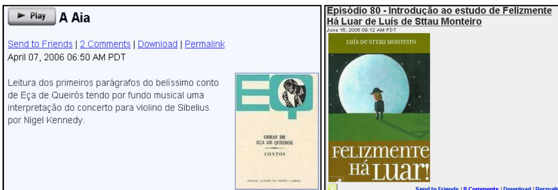
Figura 3. Podcast da disciplina de Língua Portuguesa de Teresa Pombo