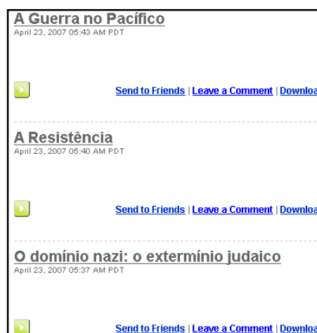
Figura 8. Episódios narrados no podcast relativos ao estudo da II Guerra Mundial

Assim, os alunos deveriam procurar livremente informação na Web sobre o assunto a tratar em cada aula e colocar online o ficheiro áudio, previamente gravado com recurso ao Audacity 16 . Deste modo, os alunos participam na construção do seu conhecimento histórico ao mesmo tempo que utilizam meios informáticos como suporte da comunicação.