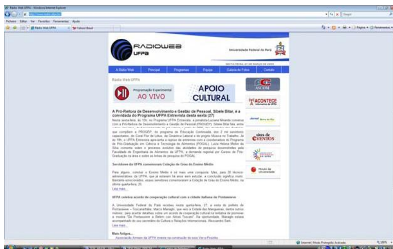
Figura 5 – Página da Rádio UFPA

A Rádio web UFPA é um canal de divulgação das actividades científicas e académicas da Universidade Federal do Pará (Brasil). Entre os contributos que a rádio proporciona aos alunos, está a possibilidade do acesso a um amplo banco de dados através da busca por palavras-chave. O utilizador poderá ouvir e fazer o download dos programas sobre os mais variados temas (educação, genética, aquecimento global, literatura, cultura, ciência, entre outros) veiculados e armazenados na plataforma da rádio, assim como palestras e entrevistas. Trata-se de um importante instrumento pedagógico, informativo, e de socialização do conhecimento científico produzido pelos departamentos e centros de investigação da Universidade Federal do Pará ( http://www.radio.ufpa.br/ ).