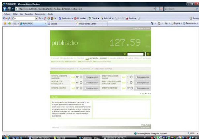
Figura 4 – Página da Publiradio.Net