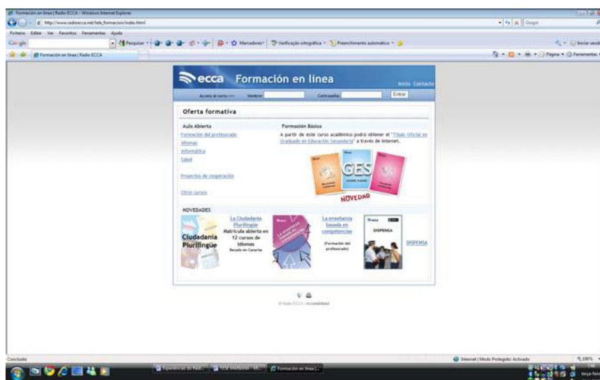
Figura 3 – Página da Radio ECCA

De acordo com os dados estatísticos disponibilizados no do site da rádio de 2002 a 2007, foram 2.215.906 alunos de várias nacionalidades receberam formação pelo Sistema Rádio Ecça de ensino ( www.radioecca.org ).