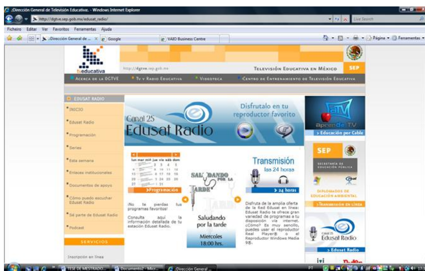
Figura 2 – Página da Televisión Educativa en México (Edusat Radio)

Em 2005, o Governo do México criou um projecto conjunto de rádio e televisão educativa na Internet com o objectivo de desenvolver uma cultura mediática no país. A Edusat Radio está inserida no ambiente virtual da Direcção Geral de Televisão Educativa, e desenvolve a sua programação em torno de uma grande variedade de géneros: educativos, culturais, artísticos, musicais, jornalísticos, científicos e tecnológicos em prol da sociedade civil mexicana, com o objectivo de contribuir para o desenvolvimento integral dos indivíduos e de suas comunidades no país ( http://dgtve.sep.gob.mx/edusat_radio/ ).