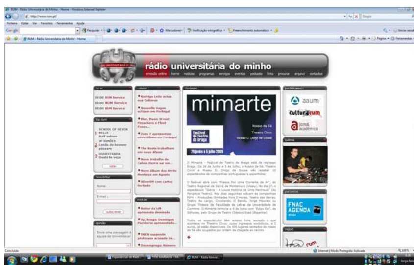
Figura 6 – Página da RUM Online

A RUM lançou duas interfaces cruciais no contexto da sua estratégia em conquistar e fidelizar novos públicos: o website e a emissão online . A consolidação da emissão online , em particular, revelou-se como uma alternativa aos “receptores convencionais”, enfatizando a cultura, os debates sobre educação, a ciência, a economia, a política, as notícias, os informes locais, as crónicas, as entrevistas e as reportagens especializadas ( www.rum.pt ).