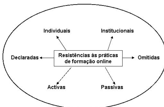
Figura 1 – Natureza das diferentes resistências às práticas de formação online

Apesar da crescente aceitação que as práticas de educação/formação online vão encontrando nos mais diversos domínios, são várias e de diversa natureza as resistências a este novo paradigma de educação/formação, umas vezes claramente assumidas, outras vezes ocultas em argumentos mais ou menos sofisticados. Na figura 1 representa-se de forma esquemática alguns dos principais tipos de resistências que normalmente urge prevenir e ultrapassar durante qualquer processo de implementação e desenvolvimento de práticas de formação em modalidade de e-learning .