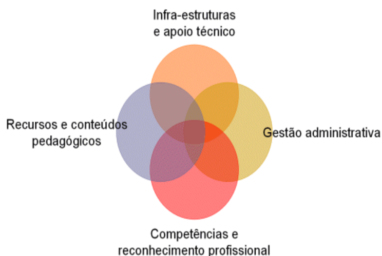
Figura 3 – Representação visual dos principais desafios associados à adopção de práticas sistemáticas de e-learning por instituições de educação/formação tipicamente presenciais.

Assim, é frequente constatarmos que, numa primeira fase, as primeiras práticas neste domínio tendem a surgir com um carácter informal, por vezes quase “clandestino”, dependente do voluntarismo pessoal de um ou poucos sujeitos, e muitas vezes associados a contextos de investigação e/ou de um certo “experimentalismo”. O desenvolvimento efectivo de uma política de formação em modalidade de e-learning por parte de uma qualquer instituição, implica que este conjunto de aspectos tenda a desaparecer para dar lugar a práticas formalizadas que sejam assumidas como “opção estratégica” da instituição, de modo a serem incorporados na prática pedagógica dos seus profissionais de uma forma sistemática e sustentada. A passagem de uma fase inicial de práticas de educação/formação em e-learning com carácter informal, decorrente de voluntarismos pessoais e motivados por interesses de investigação ou exploração prévia, para uma fase de reconhecimento institucional, adopção generalizada, e prática sistemática, coloca às instituições um conjunto de desafios que sistematizamos em quatro dimensões (GOMES, 2005): (i) desafios ao nível das infra-estruturas e apoio técnico; (ii) desafios ao nível da gestão administrativa; (iii) desafios ao nível das competências e reconhecimento profissional e (iv) desafios ao nível da disponibilização de conteúdos e recursos pedagógicos (ver figura 3).