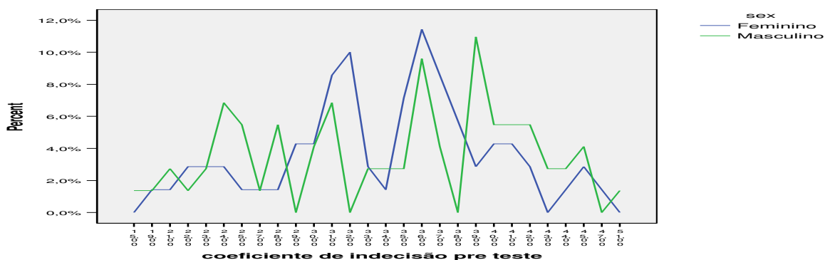
Figura 2. Representação gráfica dos índices de indecisão vocacional no momento pré-teste em função do sexo (grupo de controlo)