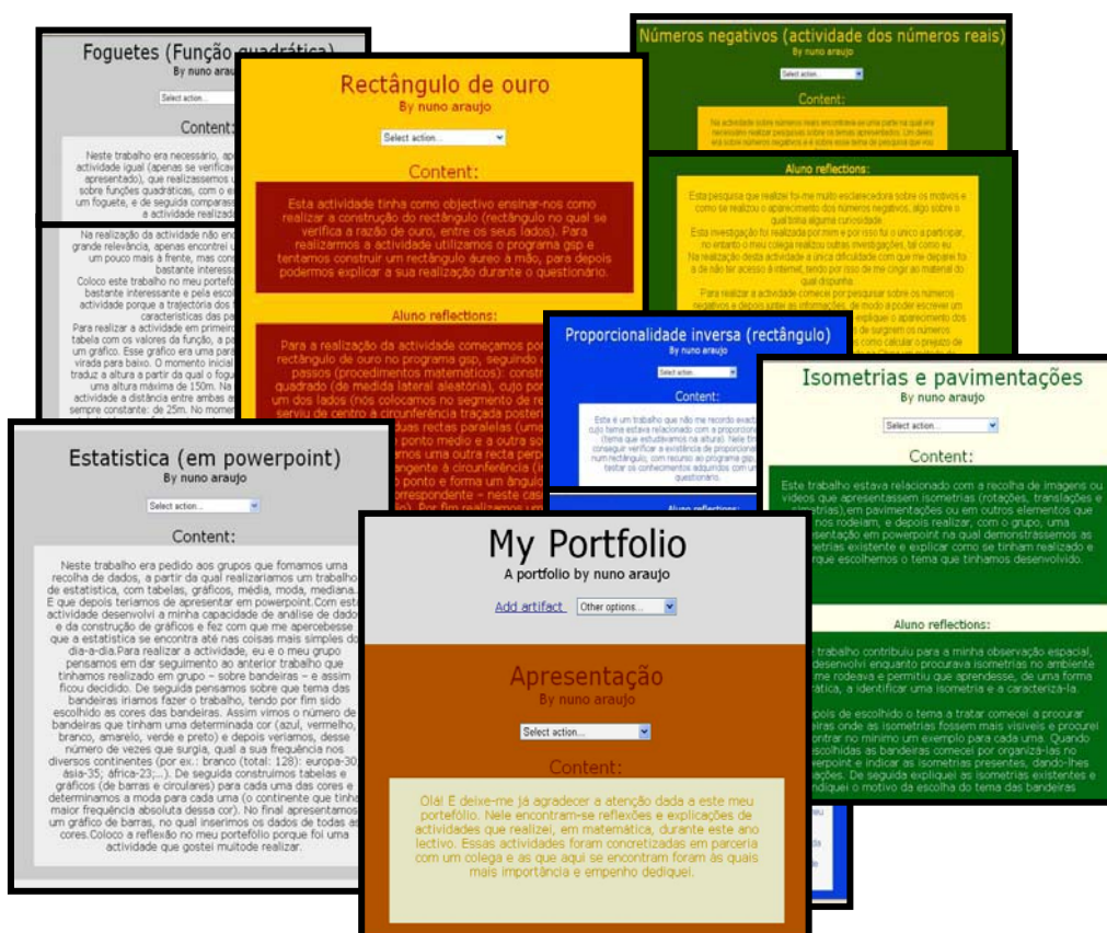
Figura 3 – Interior de um portefólio individual “My portfolio” na Moodle

Na figura 3, apresenta-se uma imagem que representa o interior de um dos portefólios individuais reflexivos, “My Portfolio”, cuja elaboração correspondeu às fases “seleccionar” e “reflectir” de um portefólio.