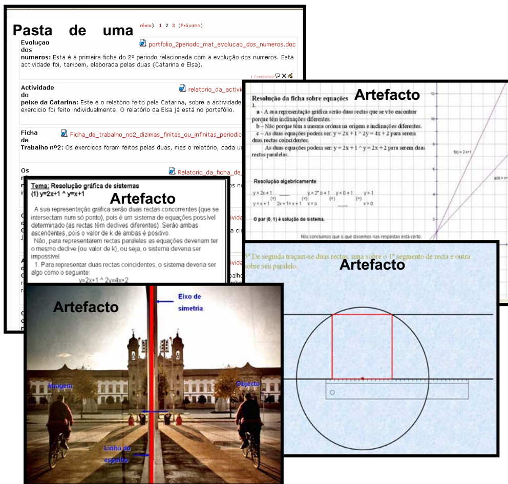
Figura 2 – Interior de uma “pasta da colecção da Moodle”

Na figura 2, pode-se observar o interior de uma “pasta da colecção da Moodle” a qual correspondia à fase “coleccionar” do portefólio.