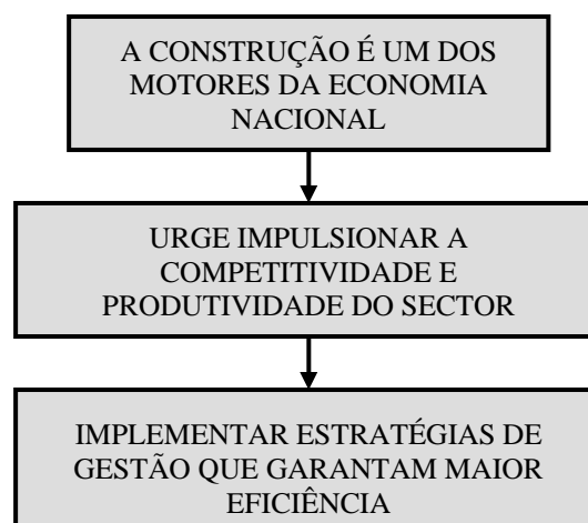
Fig. 1. A importância da implementação de técnicas de gestão adequadas

Em Portugal não se conhecem estudos relevantes sobre as causas do incumprimento dos prazos na construção (embora se discutam frequentemente as suas consequências). No entanto, a importância deste problema, justifica o desenvolvimento de um trabalho de investigação particularizado para a construção portuguesa. Este artigo tem por objectivo divulgar o estudo sobre esta problemática que os autores têm em curso inserido num amplo projecto de investigação sobre a falta de competitividade da indústria de construção nacional. O estudo contempla a análise e a sistematização das causas para a falta cumprimento dos prazos com vista a disponibilizar informação que ajude a desenvolver e implementar medidas atenuadoras, técnicas de gestão, previsão e controlo das causas dos atrasos quer na fase de elaboração do projecto quer durante o controlo e gestão das obras e assim proporcionar mais garantias de sucesso no cumprimento dos prazos na construção contribuindo para o melhoramento substancial da competitividade da indústria da construção portuguesa.