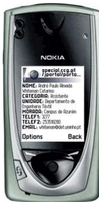
Figura 4 – Informação disponível sobre o contacto pesquisado

A segunda abordagem para este problema, bastante mais específica que a anterior, passa pelo pedido de contactos referentes ao local onde o utilizador se encontra, por exemplo um edifício, um departamento, um serviço técnico, entre outros.