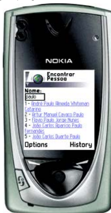
Figura 3 – Resultado pesquisa

Como resultado, é obtido o conjunto de todos os nomes que fazem match com o nome inserido (Figura 3). A pesquisa será mais refinada quantos mais nomes forem introduzidos. Para visualizar a informação associada a uma dada pessoa, apenas será necessário seleccionar o seu nome. O resultado desta operação pode ser visualizado na fig. 4.