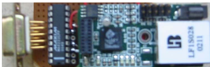
Figura 1: Hardware desenvolvido.

Para implementar o servidor Web foi utilizado um "evaluation kit" baseado num microcontrolador que permite a implementação de um servidor deste tipo e com facilidades de comunicação via protocolos RS232 e RS485 (figura 1).