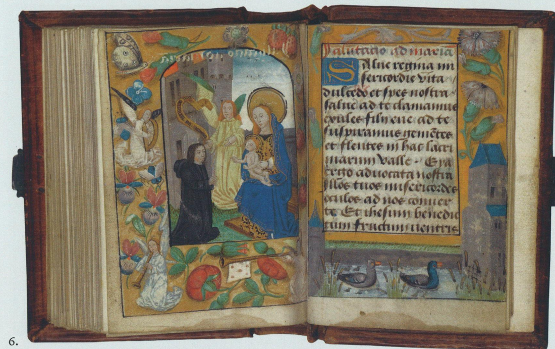
Getijdenboek van Pompejus Occo. Begin van het Salve regina , een Mariagebed. Hs. XXX E 118, fol. 141v–142r.