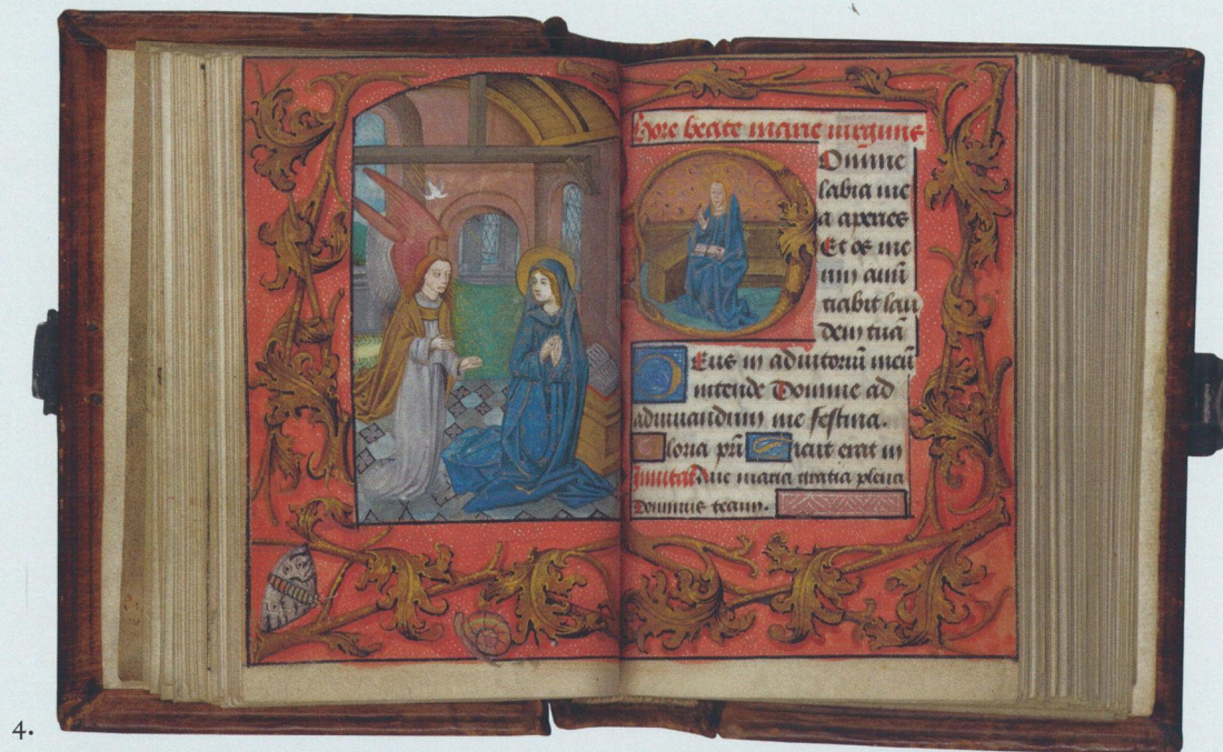
4. Getijdenboek van Pompejus Occo. Begin van de Mariagetijden. Hs. XXX E 118, fol. 31v–32r.