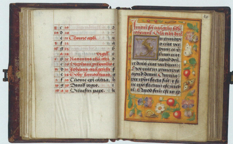
5. Gebedenboek van Pompejus Occo. Einde van de kalender en begin van een evangelieperikoop. Hs. XXX E 119, fol. 19v–20r.