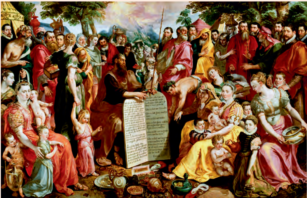
Afb. 1 Maarten de Vos, Portret van de familie Panhuys met Mozes , ca. 1575.