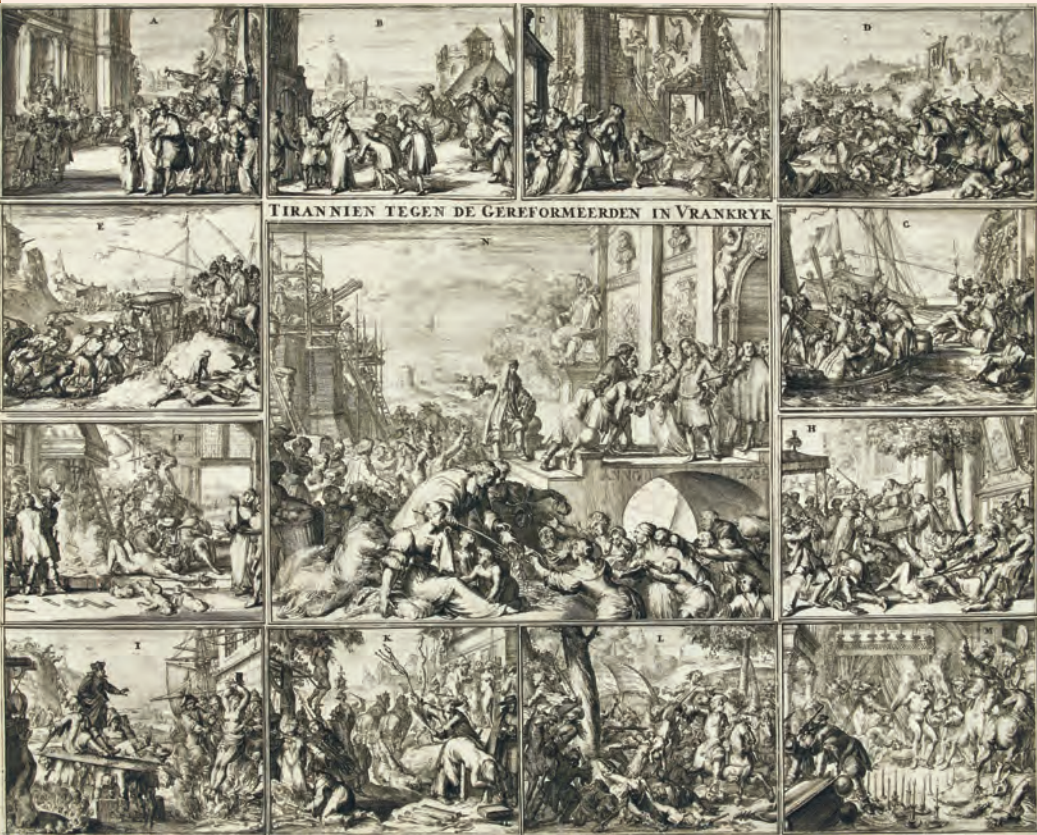
Afb. 2 Romein de Hooghe, Vervolging van protestanten in Frankrijk, 1686.

expansieve, confessionele en moderniserende staten. Toch liepen de ambities van vroegmoderne autoriteiten niet zelden parallel aan die van verdreven religieuze groepen. Brandenburg-Pruisen, bijvoorbeeld, nam vanaf de zeventiende eeuw veel ontheemde protestanten op. Deze migranten werden vervolgens gevestigd in gebieden zoals Oost-Pruisen waar ze hielpen de autoriteit van de Brandenburgers te versterken, lokale economieën te stimuleren en de confessionalisering van perifere gebieden te bevorderen. Ook de Nederlandse Republiek en Engeland profiteerden in sterke mate van de opname van vluchtelingen. Zij vormden de ruggengraat van expanderende maritieme economieën, versterkten de groeiende legers van zeventiende-eeuwse staten en hielpen overzeese kolonies bevolken. De rekrutering van verdreven protestanten voor de kolonies van Nieuw-Nederland en Zuid Afrika zijn voorbeelden