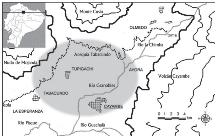
Figura 1. Visión general del área de estudio, con su localización en el Ecuador. El óvalo sombreado indica la zona de concentración de las florícolas (modificado de Mena-Vásquez et al., 2016).

res a comerciantes o grandes productores de flores. Más de 600 pequeños productores venden flores para exportar a comerciantes internacionales, con sus pequeñas fincas dispersas entre las más grandes (Figura 2) (Mena-Vásquez et al., 2016). Esta serie de cambios en la producción, la sociedad y el ambiente en la región ha llevado a la pregunta central de este texto: ¿Cuál es la influencia relativa de la certificación privada en las transformaciones socioambientales en esta región florícola del Ecuador?