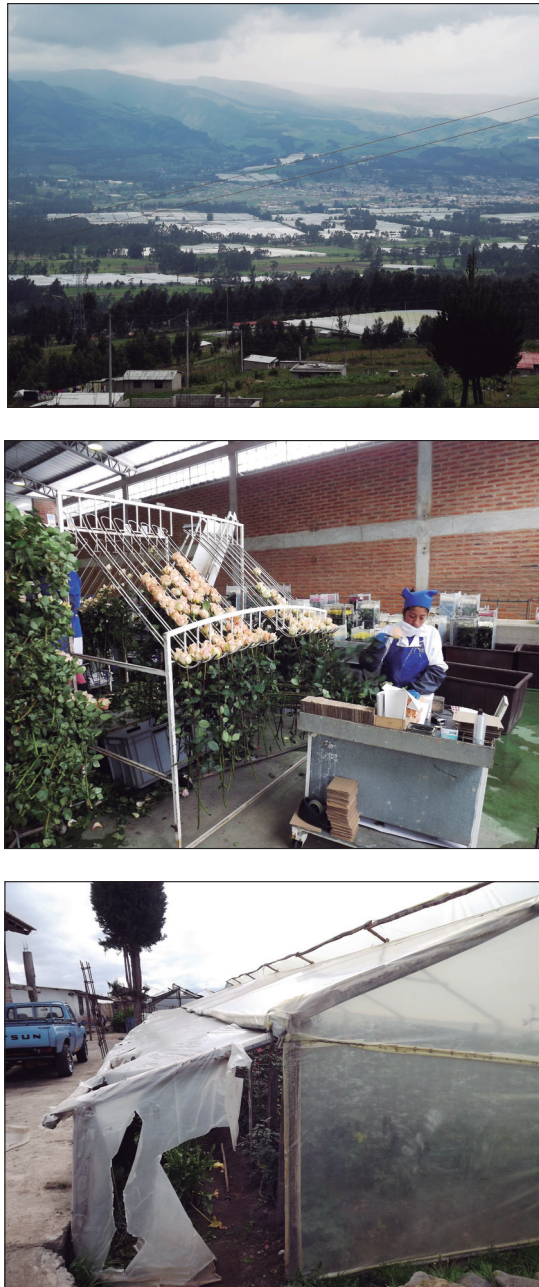
Figura 4. a) Visión parcial de la cuenca del Pisque con dominancia de florícolas grandes b) facilidades de poscosecha en una florícola grande c) Una microflorícola