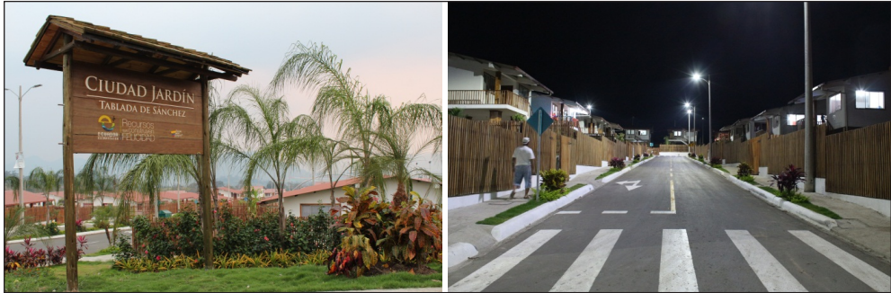
Figuras 5 y 6. Comunidad del milenio «ciudad jardín».

Entre las nuevas reglas de convivencia de la comunidad estaban: organizarse por bloques para mantener los espacios comunes, la prohibición de hacer fiestas pasada la media noche y tener animales de corral o cerdos y no dejar inhabitada la casa por más de 15 días, de lo contrario, la EEEP analizaría la posibilidad de otorgarle la vivienda a otra familia. 15