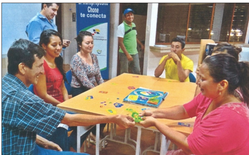
Figura 7. Habitantes de Ciudad Jardín y promotores comunitarios jugando bajo la supervisión de un técnico de Ecuador Estratégico EP.

mentación tres versiones distintas del juego. Cada versión es dedicada a cada sector estratégico: minería, hidrocarburos y megaproyectos hidroeléctricos. La lógica del juego es similar a la del popular juego de mesa Monopoly. Incluye colores, dibujos y cartillas informativas en lenguaje sencillo y directo, incluye dados y una trayectoria a seguir llena de casilleros que premian o castigan en base a la elección del jugador. En tanto el jugador caiga en casilleros correspondientes a obras emblemáticas del gobierno de la revolución ciudadana, el camino a la felicidad y el buen vivir está garantizado. Parte fundamental del juego conforme avanza el jugador en el tablero, es contestar una serie de preguntas que abiertamente promueven el proyecto político gubernamental. Así una cartilla pregunta ¿En Ecuador, las actividades petroleras protegen los recursos hídricos?, la respuesta es ‘Sí’; otra menciona ¿Para que se utiliza el dinero proveniente de los recursos estratégicos? La respuesta categórica es ‘Para generar desarrollo al país’ y tal vez una de las más sugestivas es ¿qué significa el petróleo para el Ecuador? La única respuesta es ‘Desarrollo, prosperidad y bienestar’. Así, las normas y verdades del gobierno son presentadas a los habitantes de la comunidad, los nuevos iguales, en una forma sutil y lúdica.