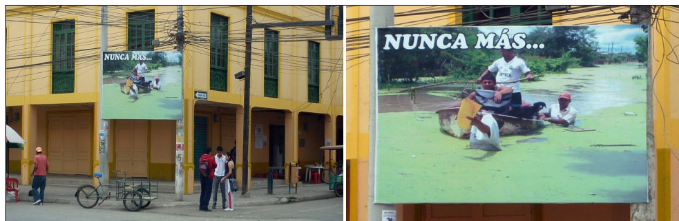
Figuras 2 y 3. Gigantografía en una esquina de la ciudad de Chone.

La justificación de la obra como prioritaria para la ciudad y la subestimación de las áreas rurales afectadas se reflejan en lo extemporáneo del Estudio de Impacto Ambiental (EIA) y del proceso de participación social. Tal como manifiesta un campesino afectado: «el punto de ellos [SENAGUA] es hacer el embalse aquí y de ahí recién ver cómo nos van a reubicar... no tienen un plan...». 8 Esto es ratificado por un informe interno de la misma SENAGUA (2012) en donde se ratifica que el proceso de licencia ambiental y participación social tuvo lugar casi cinco meses después de haber firmado el contrato de construcción del proyecto.