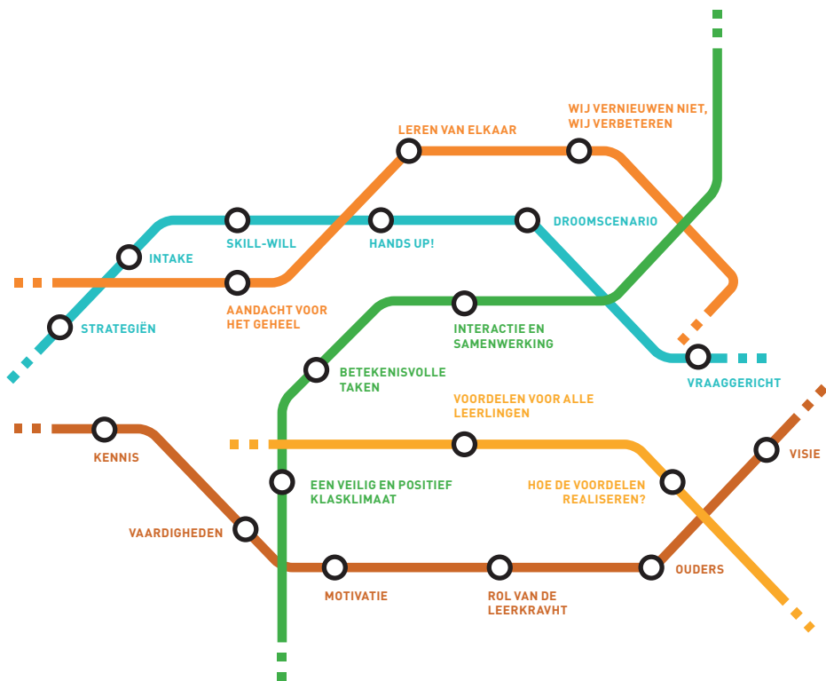
Figuur 1 De startpagina van MetroTaal – Mind the gap