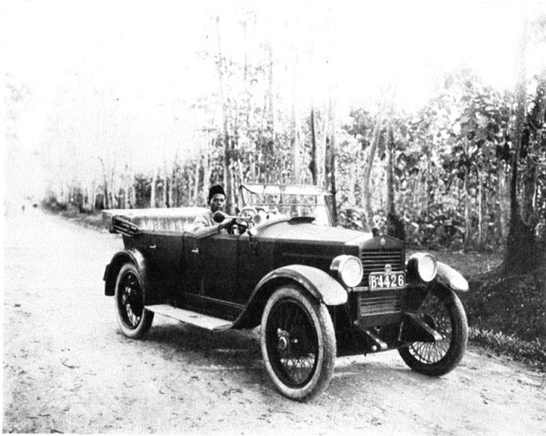
☒ DE ESSEX-WAGEN WAARIN DE REIS DOOR INDIË WERD GEMAAKT MET DEN MALEISCHEN CHAUFFEUR SAIMOEN ☒ ☒ ☒ ☒ ☒ ☒ ☒ ☒ ☒ ☒ ☒ ☒

Afbeelding 1.