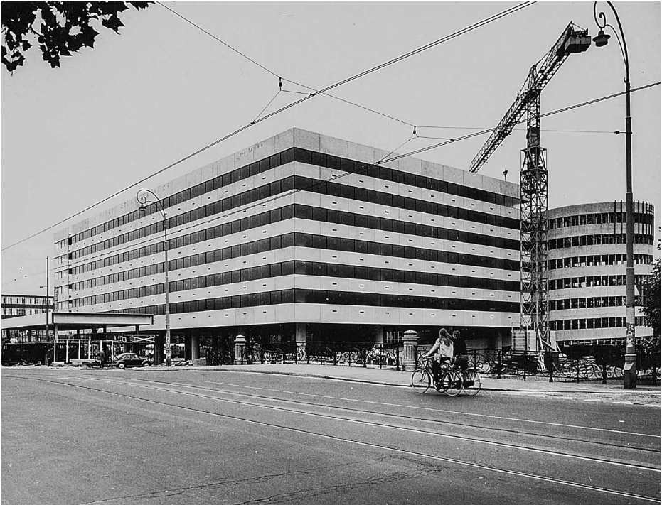
De Europarking in aanbouw, gezien vanaf de Marnixstraat op 10 juni 1971.

winkels en uitgaansgelegenheden als oorzaak van de leegstand. Het Leidseplein ligt op 600 meter afstand en de winkels in de binnenstad nog verder. Tabak maakte een oplossing voor de parkeergarage niet meer mee. Hij overleed in januari 1974 aan de gevolgen van een roofoverval in zijn garage aan de Spuistraat. 13 Voor zover bekend bleef de parkeergarage sinds haar opening altijd verlieslijdend, ook bij de latere exploitant Q-park. Daarbij komt dat de maatvoering van de garage te smal is voor grotere typen moderne personenauto's. In de meest recente plannen van de gemeente voor de voormalige Appeltjesmarkt draagt het gebied een bestemming als evenemententerrein. Na de herontwikkeling van het ge- 13 NRC Handelsblad, 25 januari 1974.