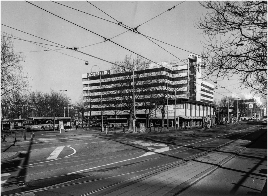
De Europarking met links het busstation op 1 april 1996. Aan de Marnixstraat staat de toonzaal.

De Clercq, Zubli op te richten. Zijn meest bekende gebouw is het Burgemeester Telleghenhuus aan de Jodenbreestraat. Het gevaarte uit 1971 stond beter bekend onder de naam het 'Maupoleum' en genoot de twijfelachtige reputatie het meest lelijke gebouw in Amsterdam te zijn. In 1997 werd het zonder protest gesloopt.