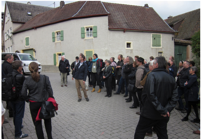
Afb. 1 Start rondleiding in Neustadt.