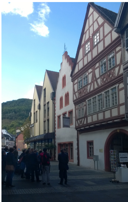
Afb. 3 Een van de vele vakwerkhuisen in Neustadt.

Al met al een bijzonder fascinerende bijdrage die ervoor zorgt dat de bezoekers in het vervolg met andere ogen naar een wijnberg kijken. Op donderdagmorgen werd voorafgaand aan de congresexcursie de ledenvergadering gehouden. Met twee bussen werd vervolgens een bezoek gebracht aan de dorpen Lachen en Hambach, met een tussenstop in Schloss Hambach. Lachen en Hambach liggen al zo'n 1200 jaar tussen de wijnvelden en bestaan uit lintbebouwing met een