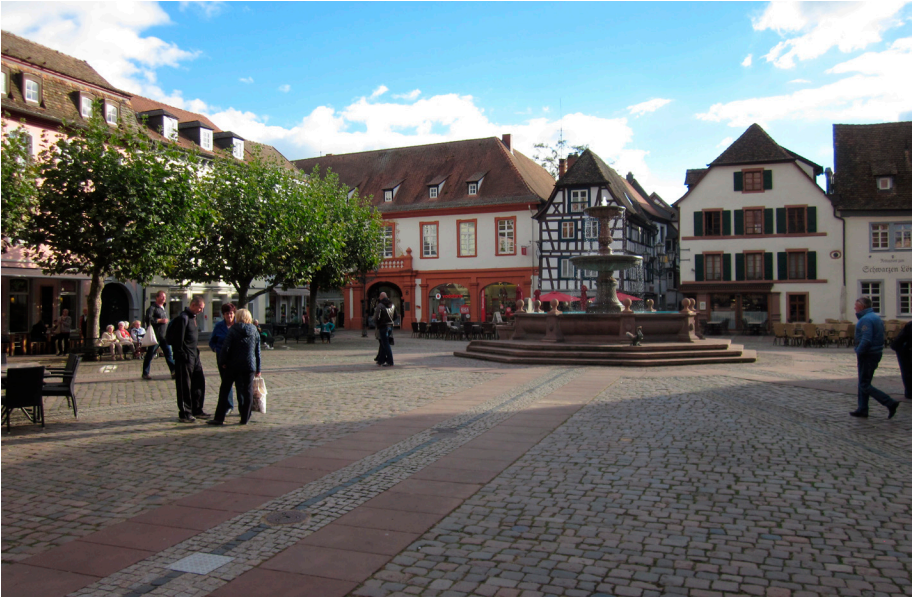
Afb. 2 Marktplein in Neustadt.