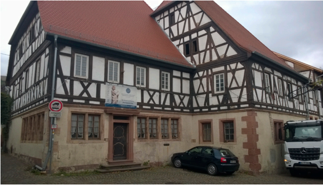
Afb. 4 De herberg Haus zum Engel in Hambach.

achterstraat. In Lachen werd gewezen op de verschillende vormen van vakwerkbouw, die overwegend uit de 18de eeuw dateerden. Verreweg de meeste huizen zijn met de achterstaande gebouwen voor de productie en opslag van wijn in een L-vorm langs een hof gebouwd.