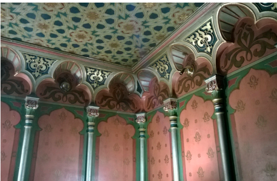
Afb. 5 Interieur van een Moorse kamer in een villa in Hambach, 1870.

Wat opviel tijdens het congres was dat het minder dan in voorgaande jaren ging om constructieve details en de datering van bouwfasen. Er is een