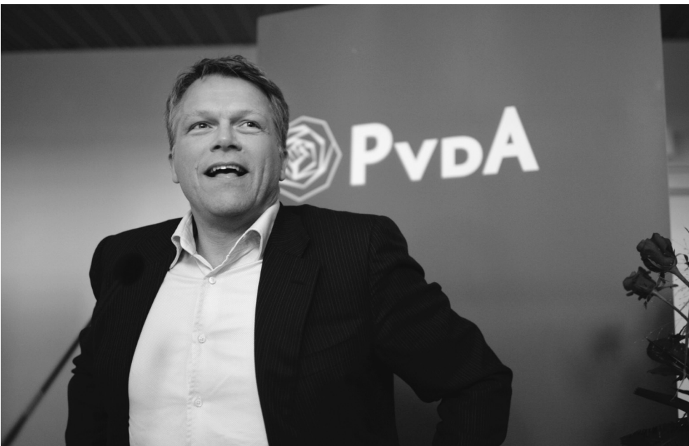
Wouter Bos.

Ik hoop dat de leden van de PvdA in meerderheid uw kandidatuur steunen, u lijkt mij de aangewezen persoon om de PvdA er weer bovenop te helpen. U heeft tenslotte uw staat van dienst al bewezen als staatssecretaris en als medewerker bij Shell.