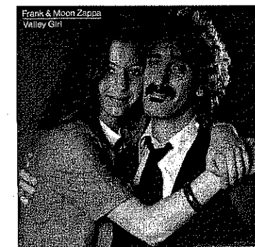
Zappa met zijn dochter Moon

Generalisaties over gender en het gebruik van nieuwe quotatieven lijken dus niet houdbaar. Sterker nog, Bucholtz en Hall (2005) tonen op micro-niveau aan dat verschillende groepen meisjes op eenzelfde Californische school nieuwe quotatieven op verschillende manieren gebruiken. De meest nieuwe, all , wordt door de groep meisjes met een nerd-identiteit niet gebruikt (zie 3), maar door de meisjes met een populaire identiteit wél (4):