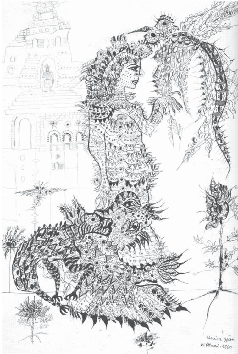
Unica Zürn, Zonder titel , 1960, pentekening in Oost-Indische inkt in een manuscript getiteld Orakel und Spektakel V. Buch , 21,5 x 30,5 cm, in Unica Zürn, Alben. Bücher und Zeichenhefte (Berlijn, 2009), 80.