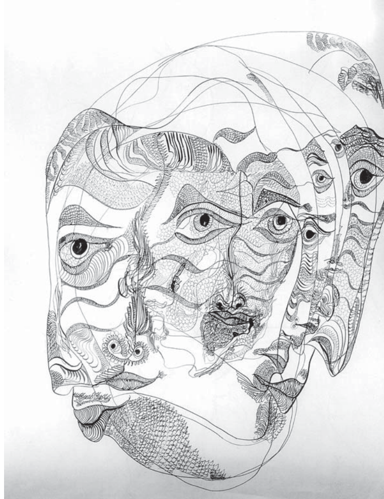
Unica Zürn, Zonder titel, 1965, pentekening in Oost-Indische inkt, 49,8 x 64,2 cm in: Unica Zürn, Bilder 1953-1970 (Berlijn, 1998), ill. cxxxvi.

De man in jasmijn en Donkere lente . 6 Van deze literaire werken zijn meerdere toneelbewerkingen en films gemaakt.