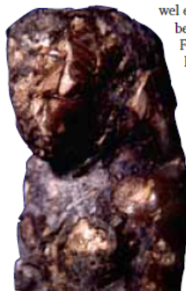
5 Ivoren votief beeldje van een vrouw.

wel eens tot de oudst bekende tempels van Egypte zou kunnen gaan behoren.