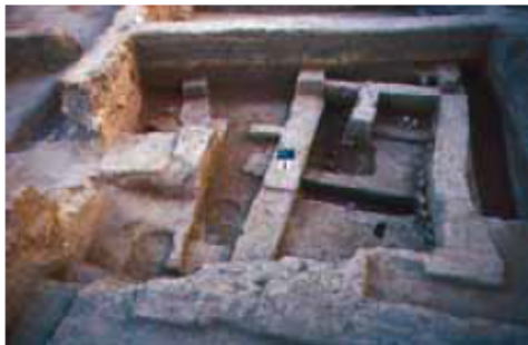
4 De votief depots in de tempelfase 2.

Zeer opmerkelijk is een graf vlak naast de tempel uit Fase 5. Door middel van aardewerk kan het precies gedateerd kan worden in de 1 e dynastie. Daarmee is direct ook de tempel in dezelfde laag gedateerd. Een graf op zo'n plek, vlak buiten de tempelmuren, en ver van andere graven, is zeer ongebruikelijk. Zo langzamerhand begon duidelijk te worden dat deze steeds verder teruggaande opeenvolging van tempels