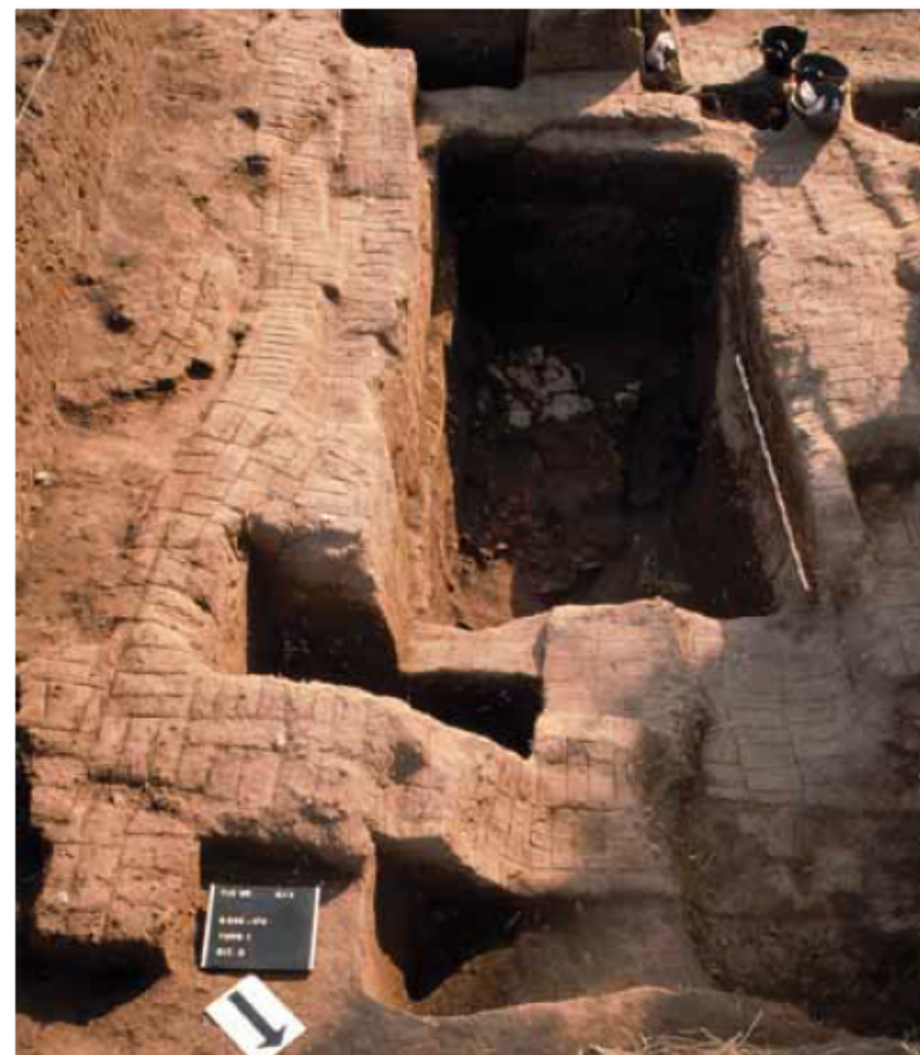
3 Het 2 e , grote Archaïsche graf.

2 Plan van het opgravingsgebied. Kaart: Willem van Haarlem