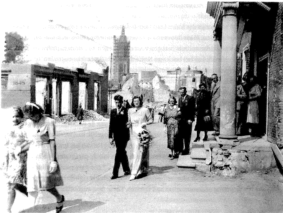
▲ Het leven gaat 'gewoon' door. Een bruidspaar wandelt tussen de puinhopen van een bombardement in Rhenen, 22 juni 1940.

En die verdachtmaking reikt verder. De laatste aflevering van de serie eindigt presentator Trip op de plek waar hij in de eerste aflevering begon: Compiègne. Uit filmisch oogpunt niet zo gek natuurlijk. Maar zij ziet er een catharsis in, waarom het de makers, zo had zij vele bladzijden daarvoor al aangekondigd, te doen zou zijn: de Europese burgeroorlog is definitief ten einde. 17 Trip zou dit de kijkers hebben voorgehouden en dan gaat Henkes als volgt verder: