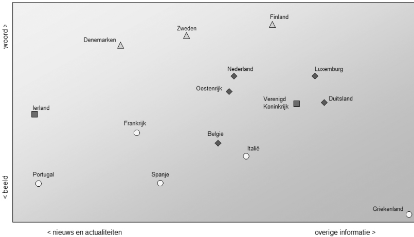
Figuur 1 Mediapreferenties in 15 EU-landen, 2002

Bron gegevens: Huysmans, De Haan en Van den Broek (2004, pp. 136-164)