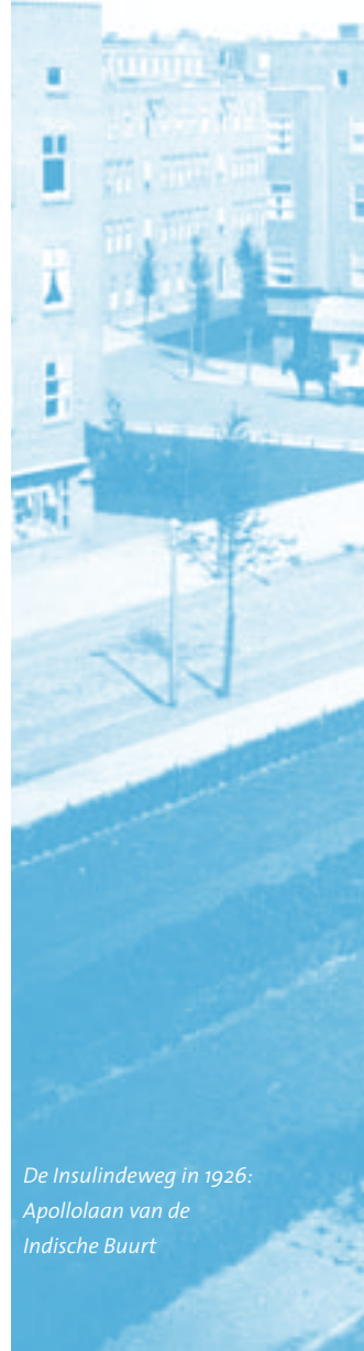
De Insulindeweg in 1926: Apollolaan van de Indische Buurt

Als vertrekpunt is het nuttig om de Indische Buurt vanuit een historisch perspectief te benaderen; als een buurt die in verschillende fasen - soms slechts een decennium lang - is ontstaan en veranderd. Het idee om de Indische Buurt in vier kwadranten op te delen, op basis van de centrale assen Molukkenstraat en Insulindeweg, past niet echt bij het leven in de wijk zoals zich dat heeft ontwikkeld. De thema's (stadswonen, zorgeloos wonen, goed wonen en parkwonen) zijn slim bedacht maar ook gezocht. In de praktijk zeggen mensen dat ze in de Indische Buurt wonen, en als mensen vragen waar precies, dan is dat bij een bekende straat, of een herkenbaar plein; elementen die bij uitstek in de Indische Buurt aanwezig zijn. Gezien de geschiedenis van de buurt en de ruimtelijke en sociale karakteristieken die daar uit voortvloeien, is er ook een duidelijk verschil tussen de Oude en de Nieuwe Indische Buurt. Ook dat speelt een rol bij de beantwoording van de vraag in welk deel van de Indische Buurt je woont. Er is al teveel kwaliteit en identiteit aanwezig in de buurt om speciaal nieuwe thema's te verzinnen.